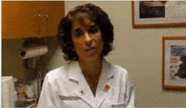
je suis vraiment