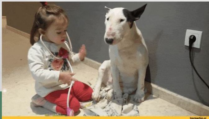
comment les hôtes me voient