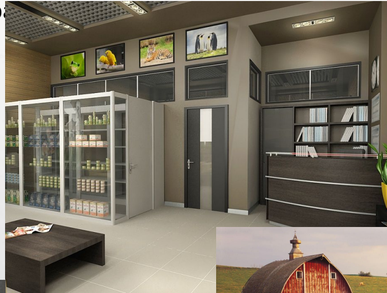
ce que nous rêvons