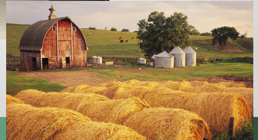
ce que nous obtenons