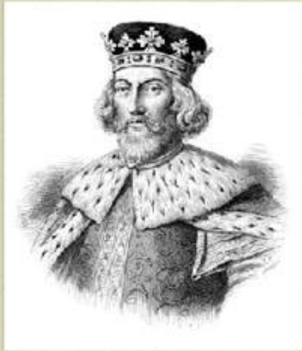
Иоанн Безземельный (1199-1216)