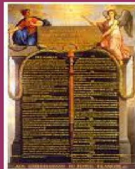
Декларация прав человека и гражданина 1789 г. во Франции