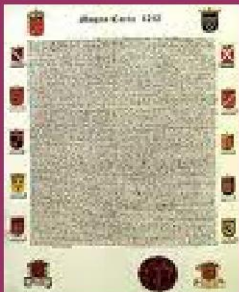
Великая Хартия вольностей 1215 г. в Англии