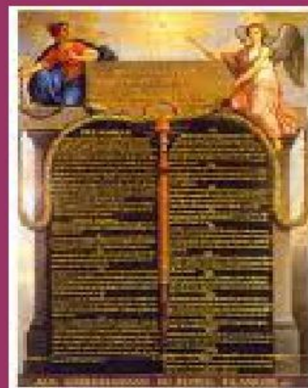
Декларация прав человека и гражданина 1789 г. во Франции