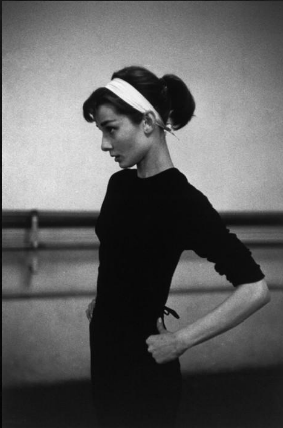
Одри Хепберн. Париж, 1956 год