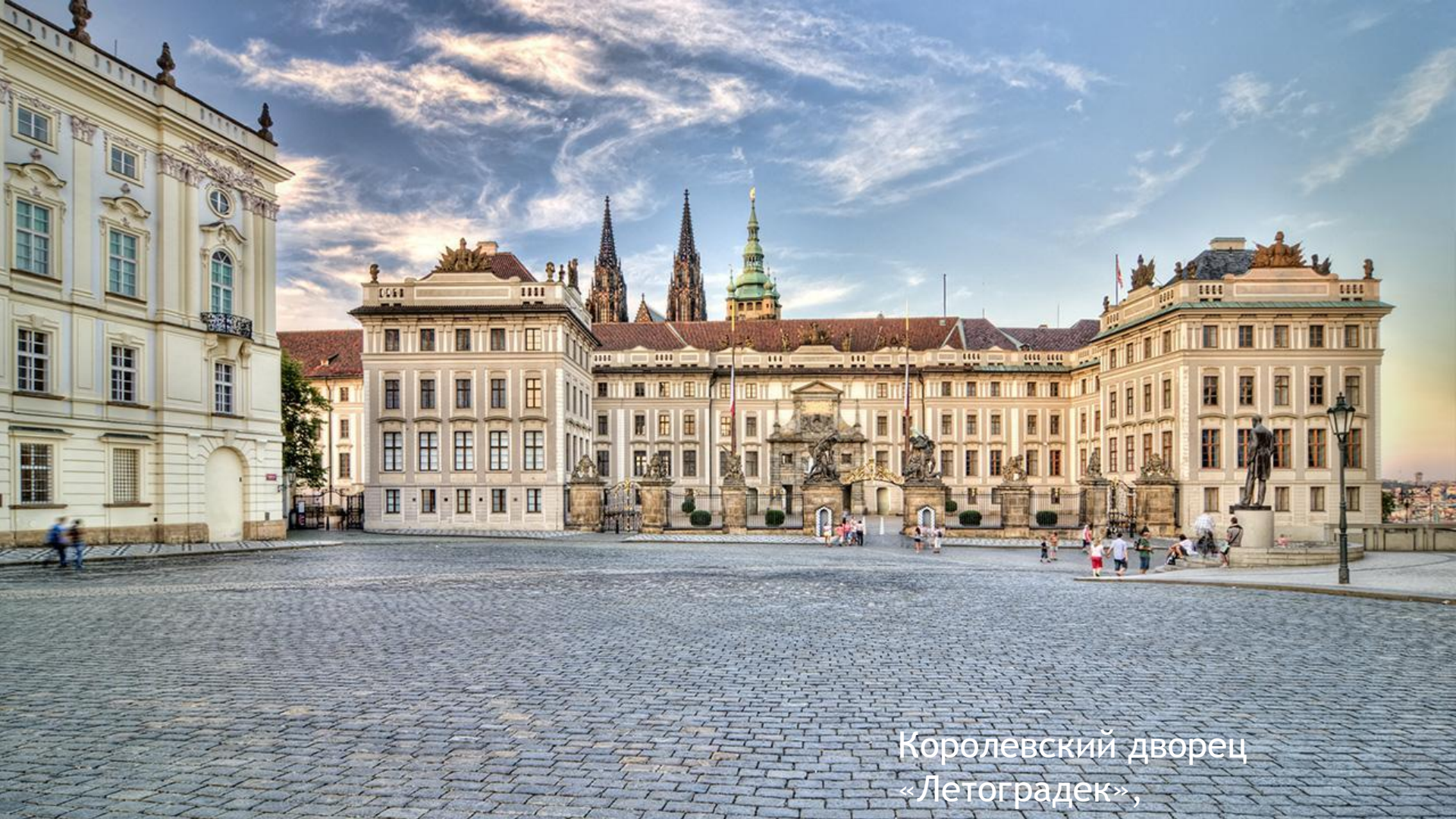
Королевский дворец «Летоградек»,

В эпоху возрождения и маньеризма появились такие архитектурные шедевры, как Владиславский зал в Пражском Граде для светских празднеств, Королевский дворец «Летоградек», поющий и мраморные фонтаны в королевском саду Рудольфа II.