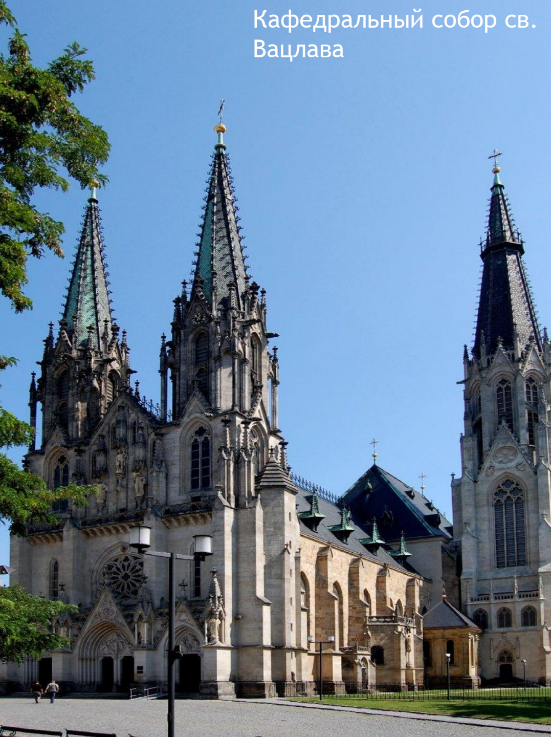
Кафедральный собор св. Вацлава

После страну охватил новый архитектурный стиль «барокко» , который был завезён сюда австрийскими завоевателями