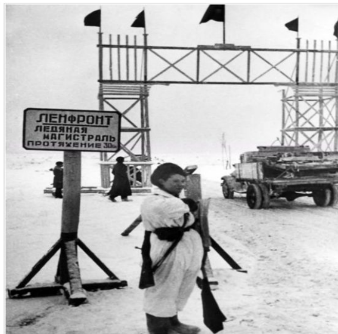
Регулировщица на въезде на ледяную «Дорогу жизни» у деревни Коккореве.

награждена орденом Отечественной войны II ст.