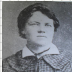
Знаменитые люди Криницы