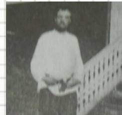
Идеи основателе й Криницы