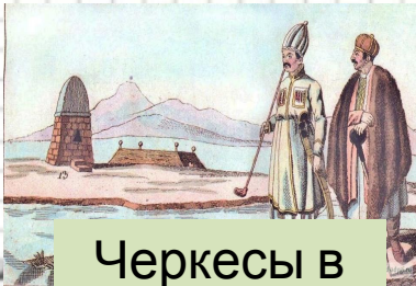
Черкесы в устье Пшады