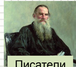
Писатели о Кринице