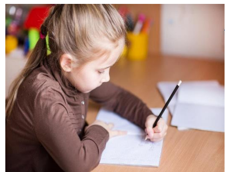
Раскрашивание и штриховка