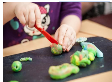
Лепка и Аппликация