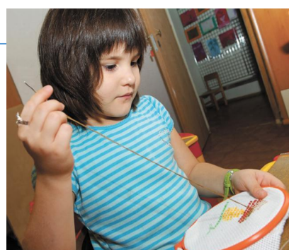
Работа с ножницами и иглой