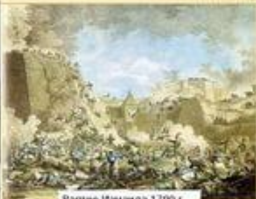
Взятие Измаила 1790 г.

Напутствие А.В.Суворова: «Сегодня молиться, завтра постыться, последняя победа или смерть».