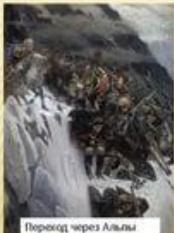
Переход через Альпы. 1799 г.