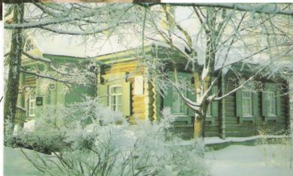
Дом-музей А.В.Суворова в Кончанском-Суворовском, повторяет облик суворовского дома