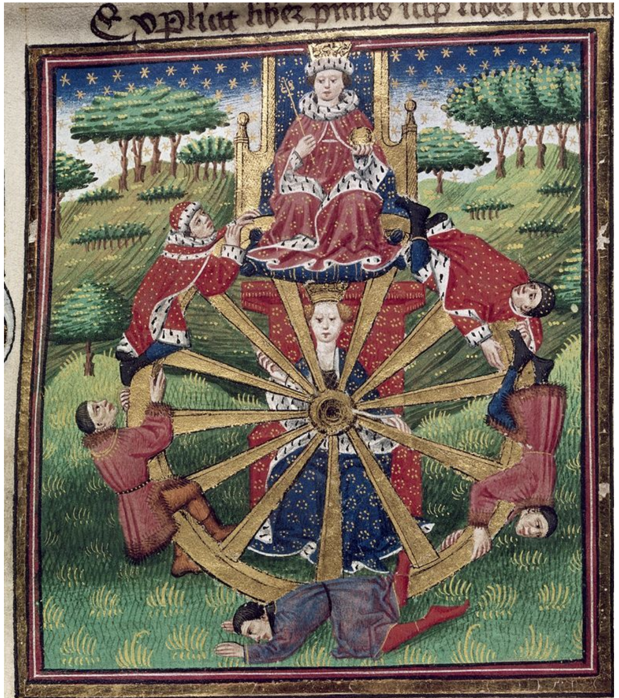
“Troy book” XV c. Wheel of fortune

Explicit liber primus incipit liber secundus