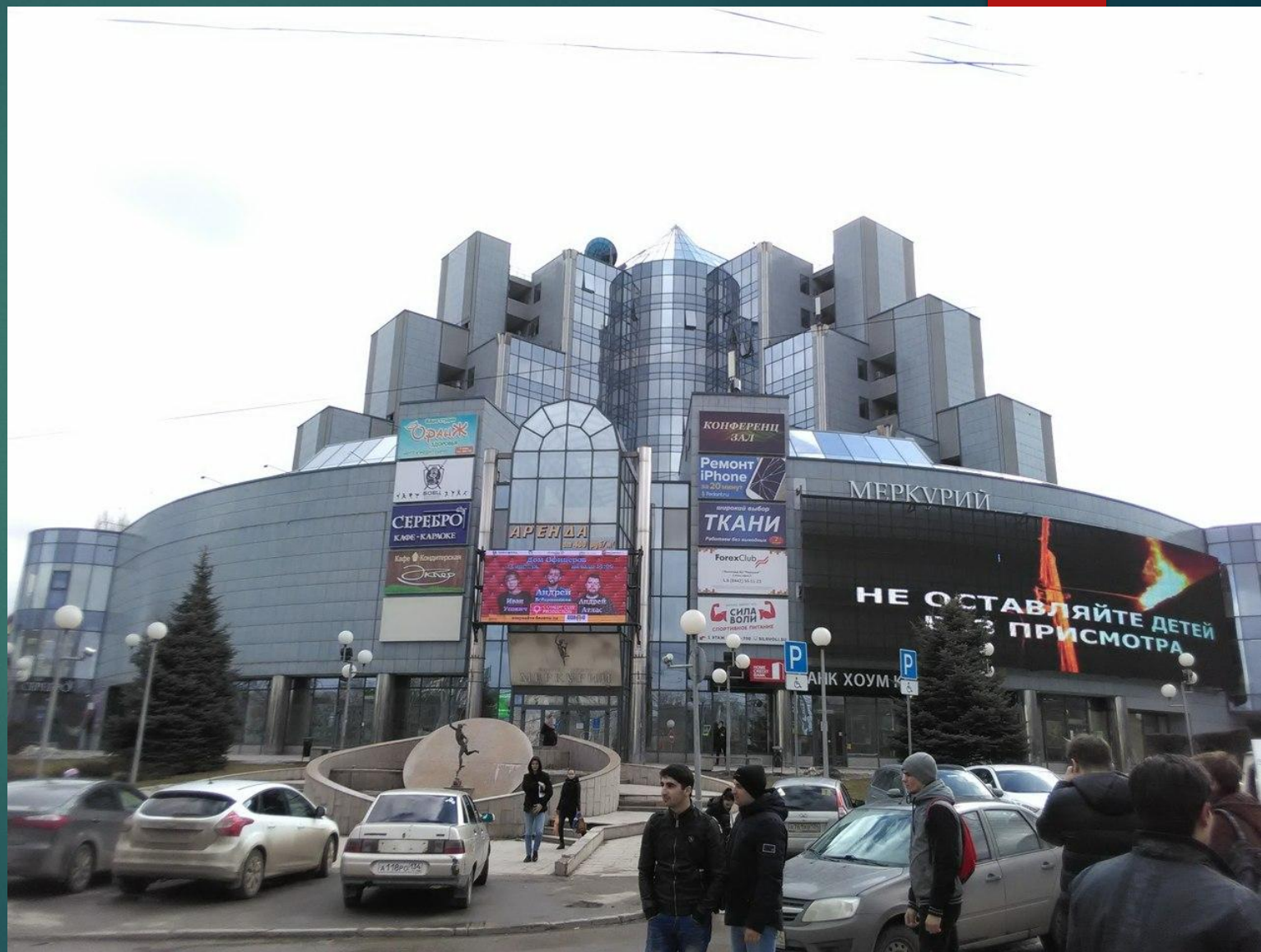
“Поколение М” у бизнес-центра “Меркурий”