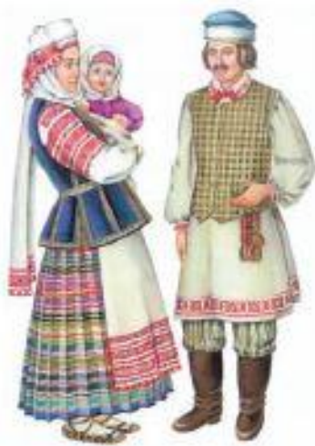
Белорусская семья в праздничной народной одежде. Конец XIX — начало XX в. Реконструкция

Из предисловия Ф. Богушевича к «Дудке белорусской»: «Можна, хто спытае: гдзе ж цяпер Беларусь? Там, братцы, яна, гдзе наша мова жывець: яна ад Вільна да Мазыра, ад Вітэбска за малым не да Чарнігава, гдзе Гродна, Мінск, Магілёў, Вільня і шмат мястэчак і вёсак...»