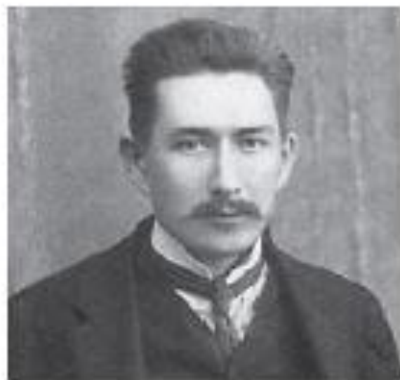
Один из основателей газеты «Наша ніва» И. Луцкевич

В статье, открывавшей первый номер газеты, отмечалось: «Не думайце, што мы хочам служыць толькі ці панам, ці адным мужыкам. Не, ніколі не! Мы будзем служыць усяму беларускаму скрыўджанаму народу...». Газета провозглашала, что будет «старацца, каб усе беларусы, што не ведаюць, хто яны ёсць, — зразумелі, што яны беларусы і людзі, каб пазналі сваё права...».