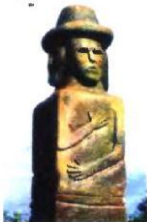
Фрагмент Збручского идола. X в. Реконструкция

Как и в предыдущие века, крестьяне обожествляли явления природы, небесные светила, деревья, реки, придерживались культа рода. Они воспринимали мир триединым: люди, космос, боги. Так, в Збручском идоле (символизирует бога – творца Вселенной Рода ) изображения расположены в трех ярусах: в верхнем – небесные боги, в среднем – люди, в нижнем – подземный мир с богом, держащим в руках землю. Религиозные обряды совершали в святилищах, которые строились из дерева. В них сооружали капище – место, где приносились жертвы богам. Здесь же находились жрецы-волхвы (волхв – мудрый), служители культа, которые помнили и совершали обряды, заговоры, исполняли ритуальные песни, вычисляли календарные сроки магических действий, знали целебные свойства трав. Изображения идолов вырезались из дерева или камня.