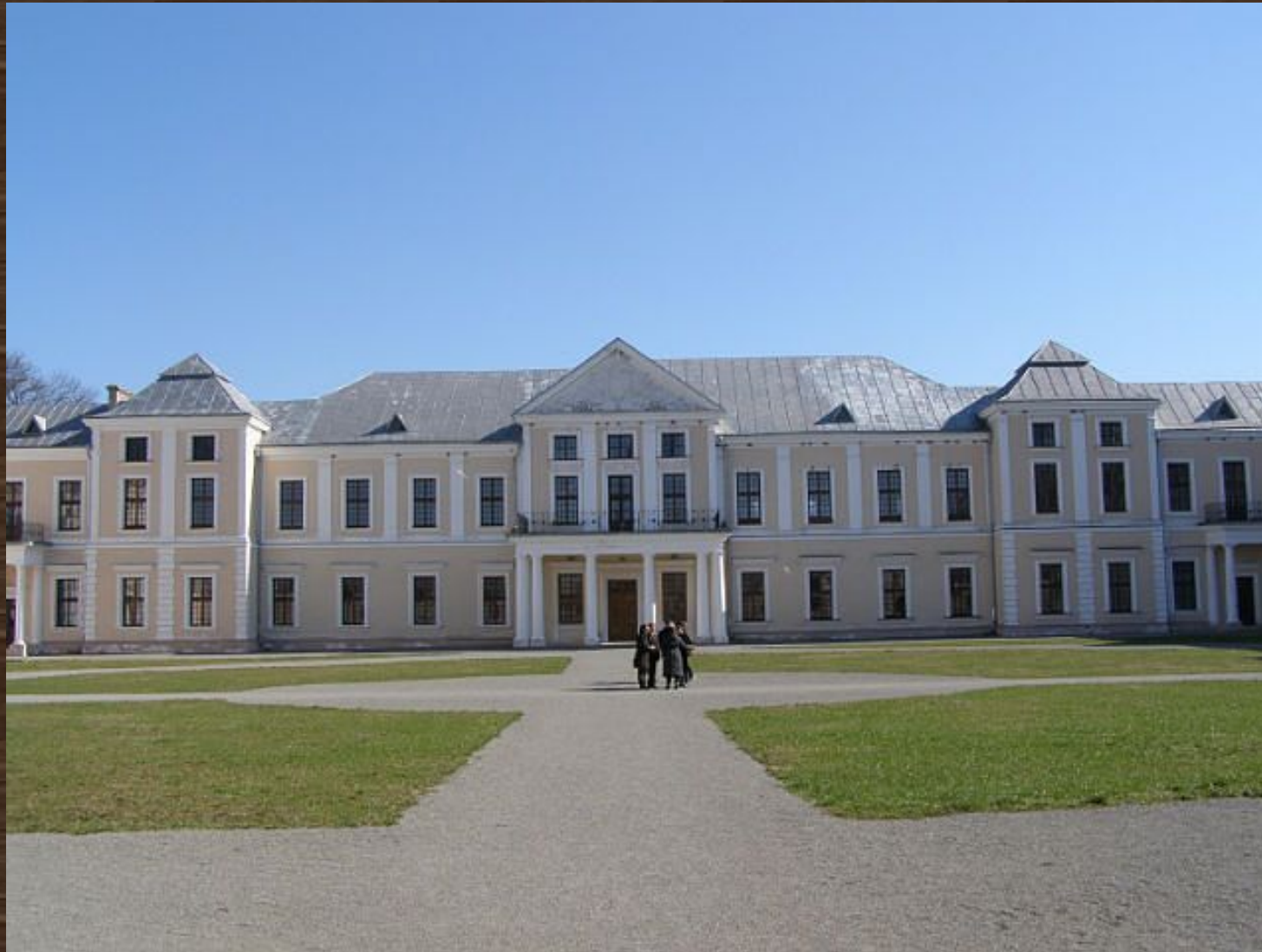
Усадьба (ранее замок) Вишневец — главная резиденция угасшего в XVIII веке княжеского рода Вишневецких в посёлке Вишневец Тернопольской области.