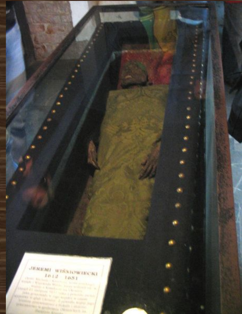
Предположительно останки И. Вишневецкого.