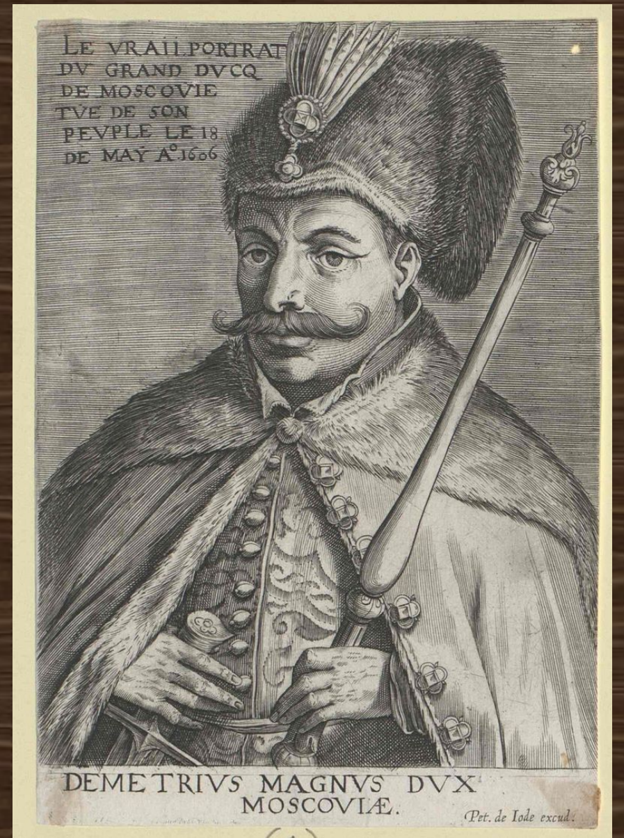
Дмитрий Великий Князь Московский. Амстердам, 1606 год. рисунок П. Иоде.