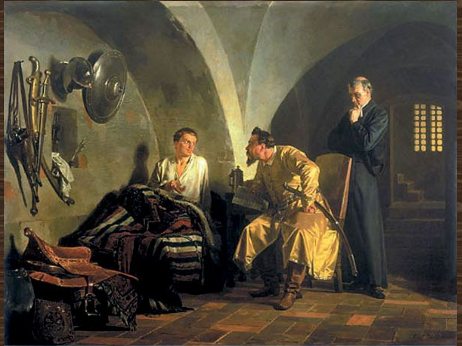
«Дмитрий Самозванец у Вишневецкого». Картина Николая Неврева (1876)