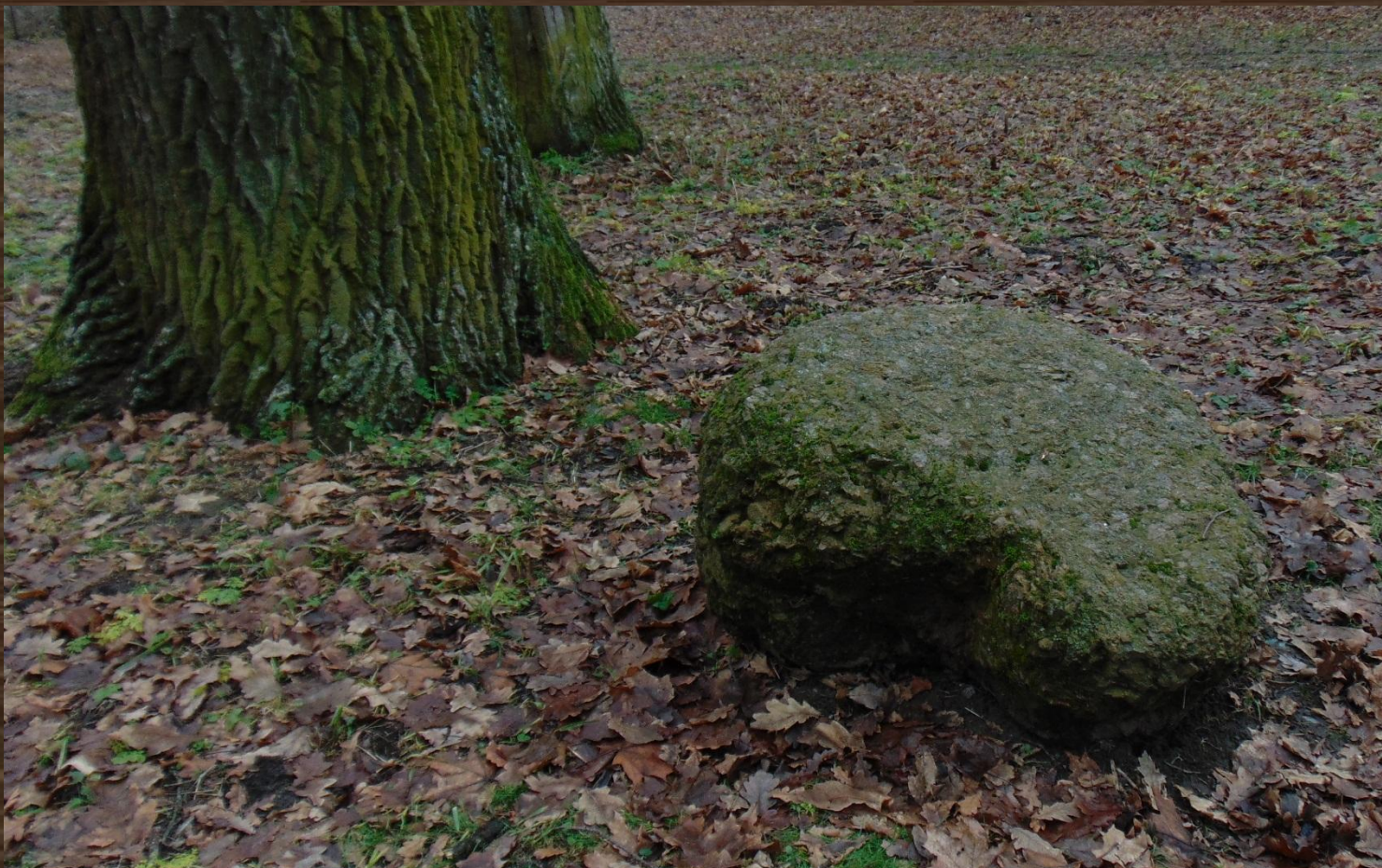
Камень-валун в виде сердца, где по легенде состоялось свидание Лжедмитрия I и Марины Мнишек