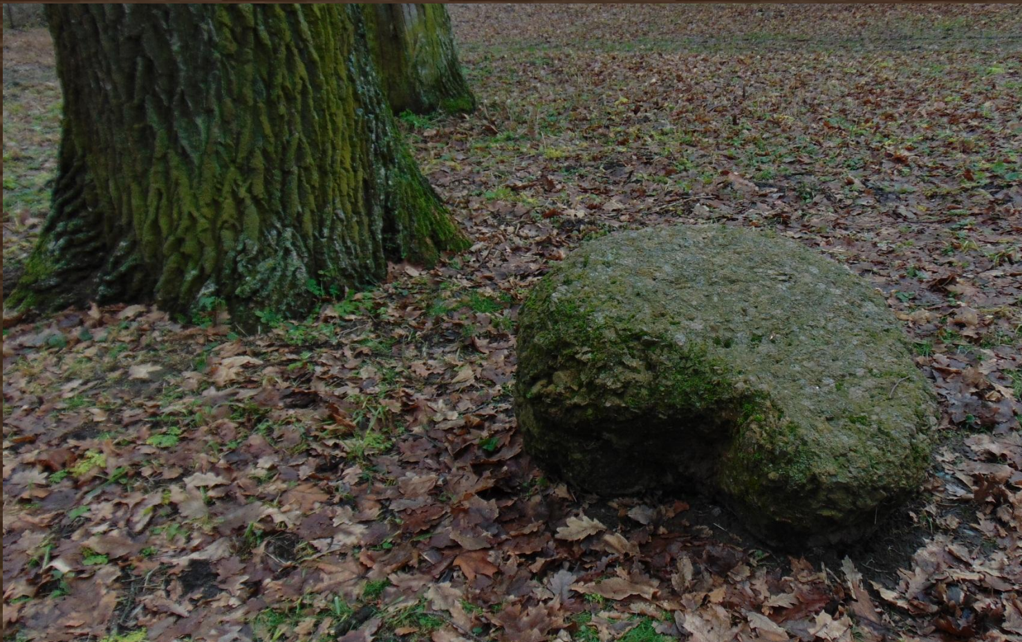
Камень-валун в виде сердца, где по легенде состоялось свидание Лжедмитрия I и Марины Мнишек