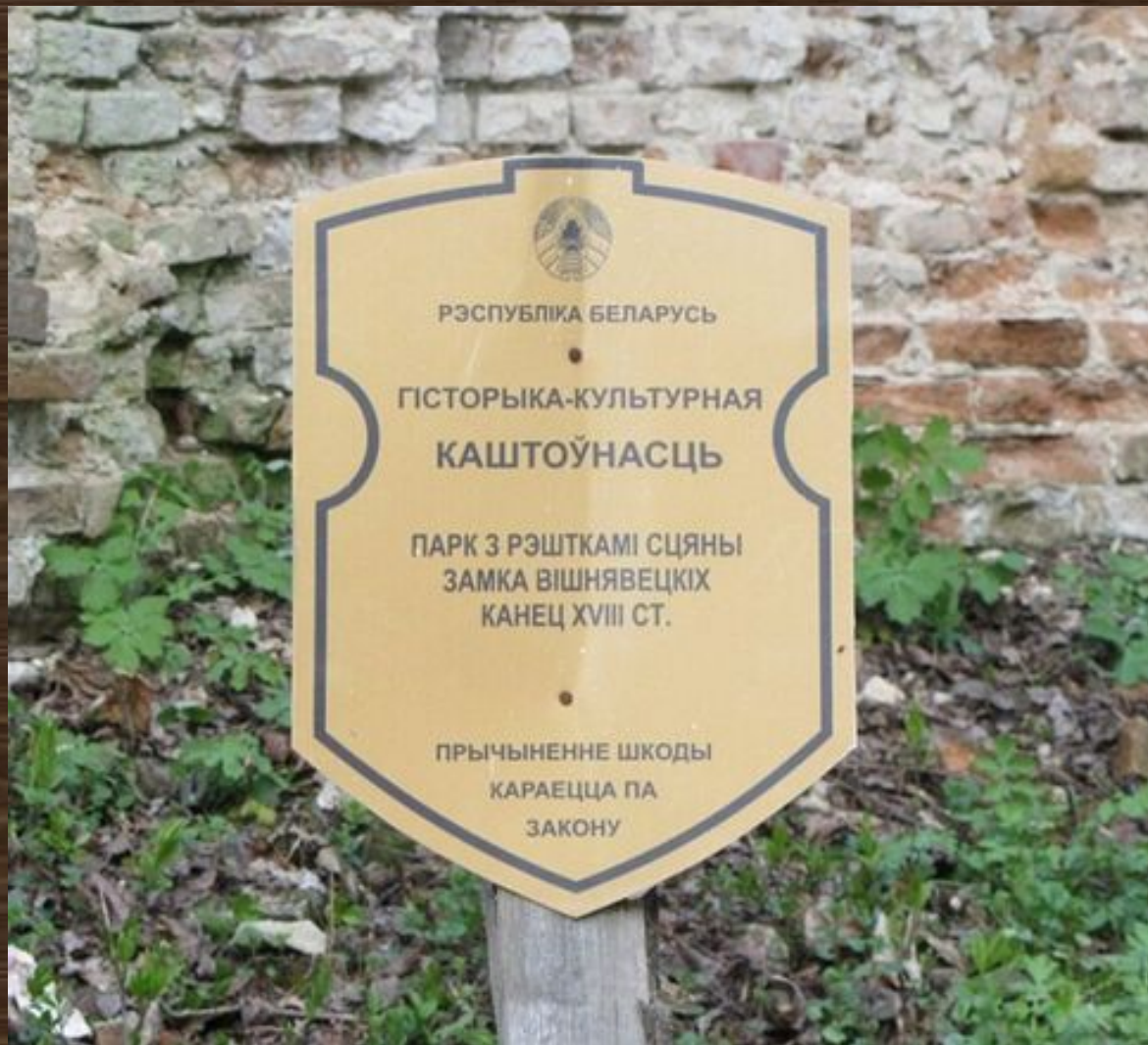
Состояние таблички в 2015 г.