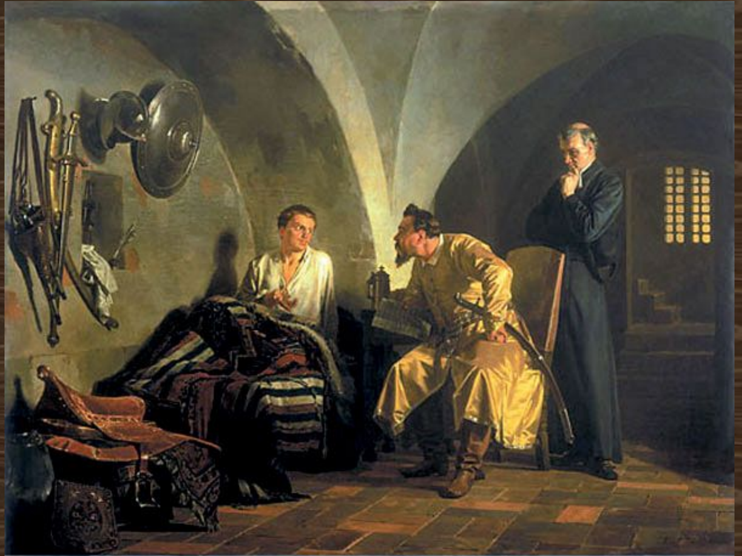
«Дмитрий Самозванец у Вишневецкого». Картина Николая Неврева (1876)