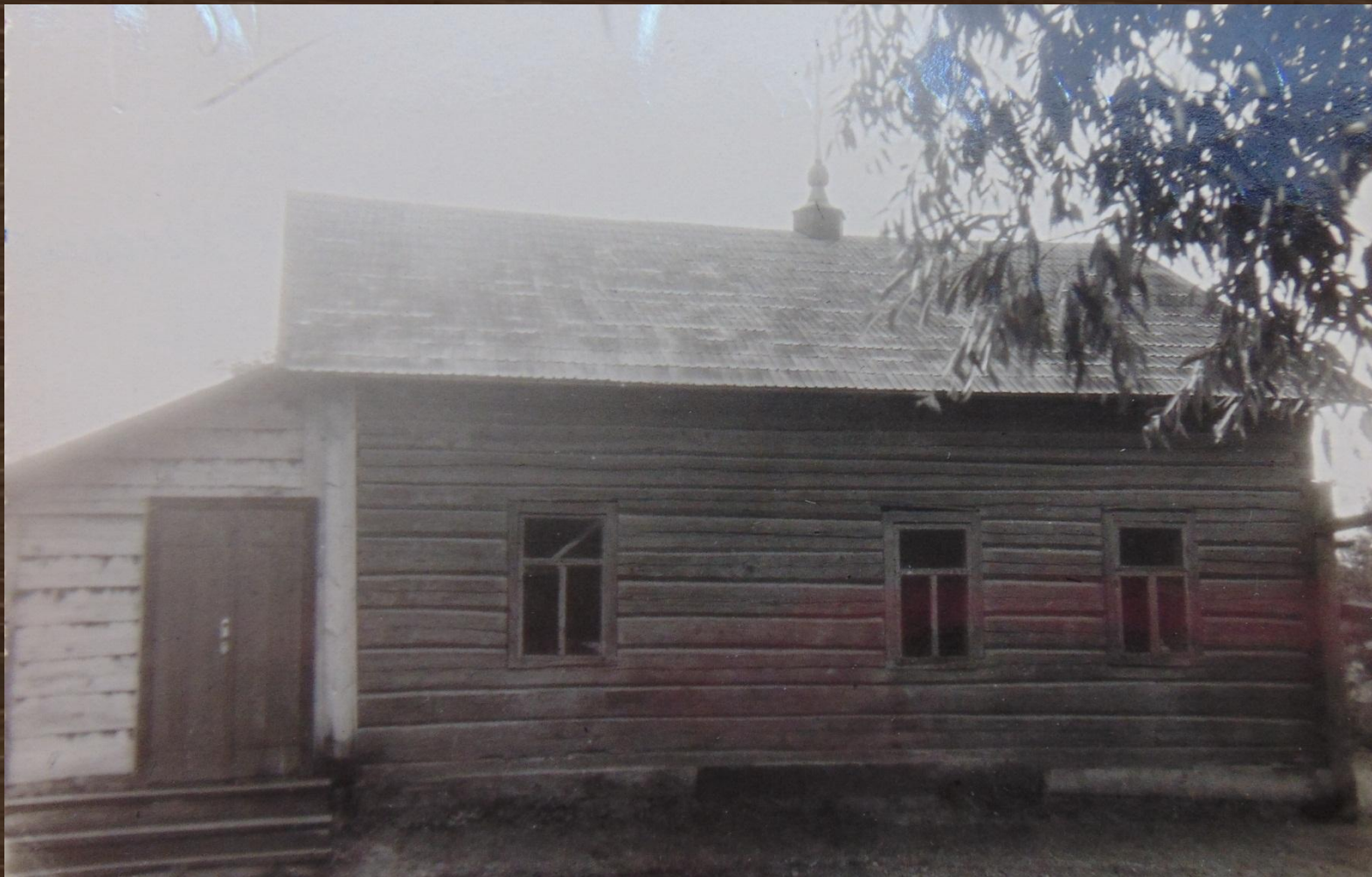
Молитвенный дом в д. Селец. Фото сер. XX века.