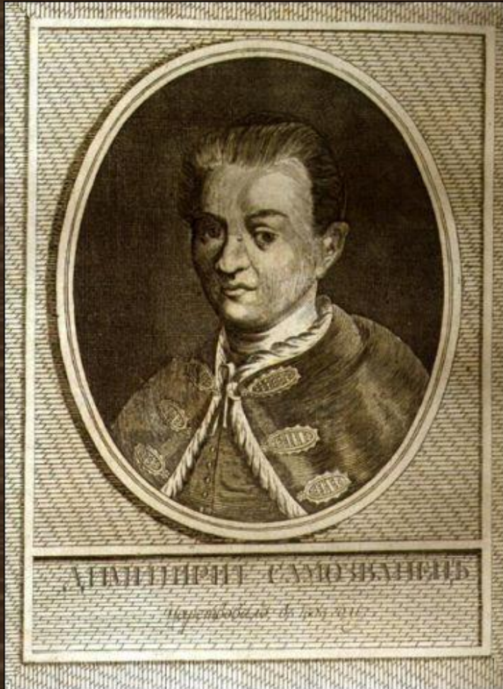
Лжедмитрий I (Гришка Отрепьев)

Князь Адам (Александрович) Вишневецкий (ок. 1566—1622) дал приют Григорию Отрепьеву в 1603 г. в Брагине. Позже тот объявил себя царевичем Дмитрием и в 1604 г. отправился в поход на Москву.