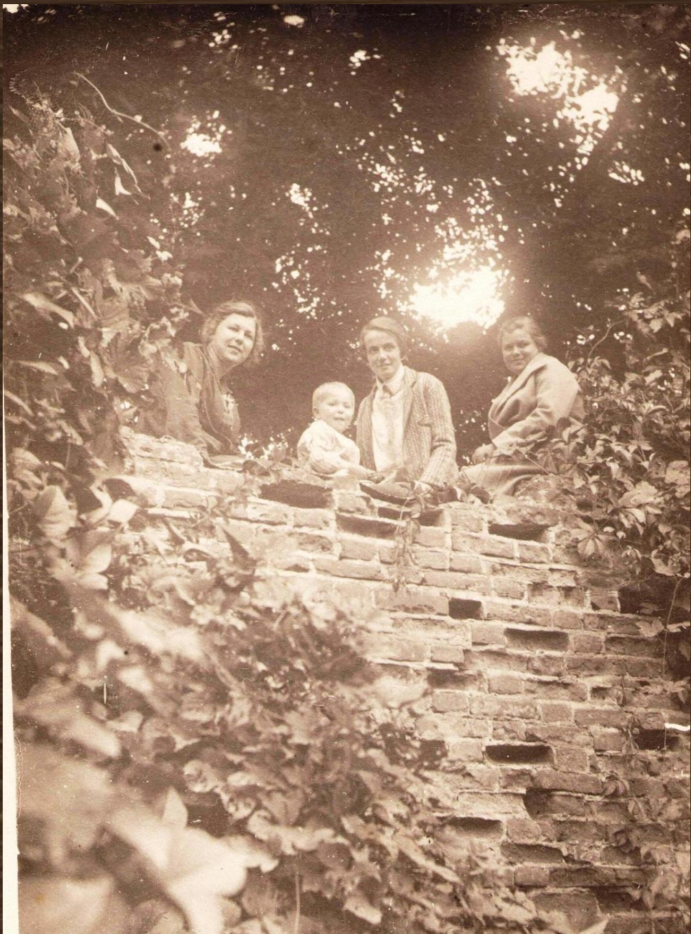
Остатки стены замка Вишневецких фото нач. 20 века