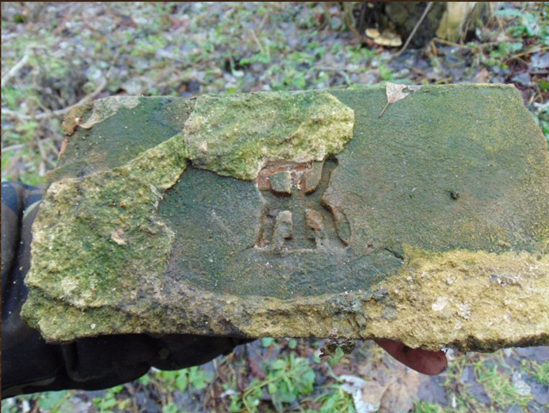
Кирпич с клеймом в виде букв «ЯК» из погреба имения Патонов