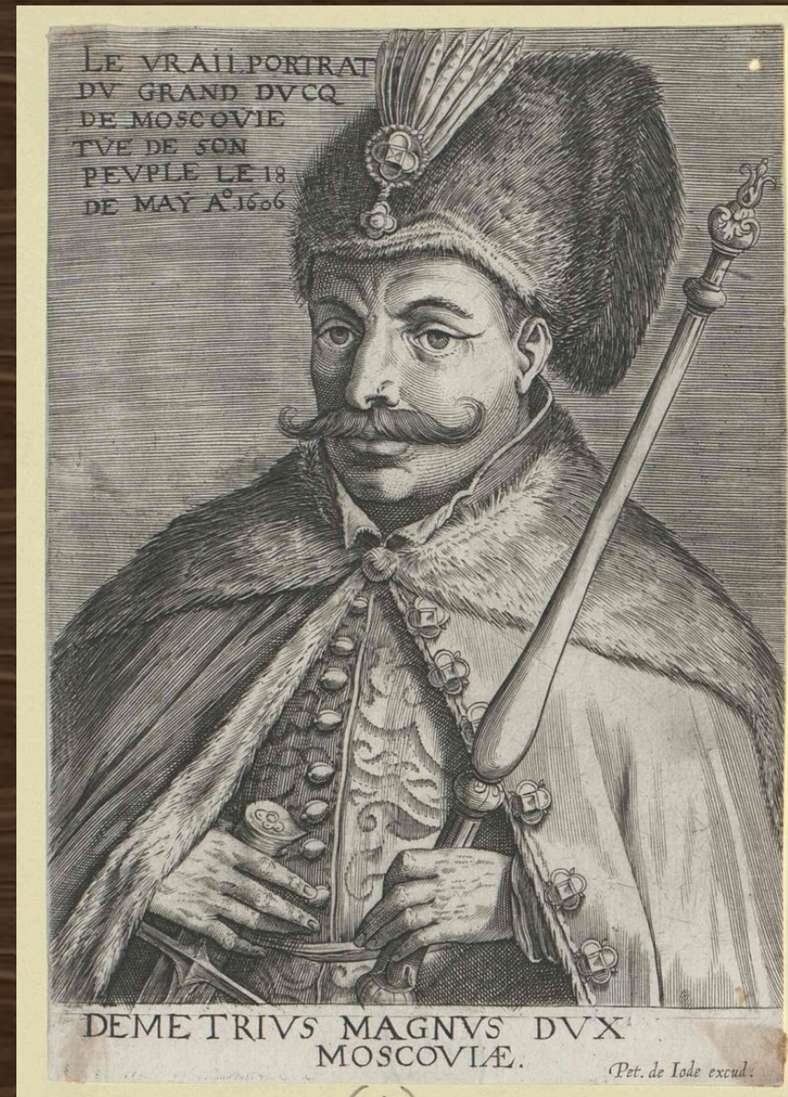
Дмитрий Великий Князь Московский. Амстердам, 1606 год. рисунок П. Иоде.