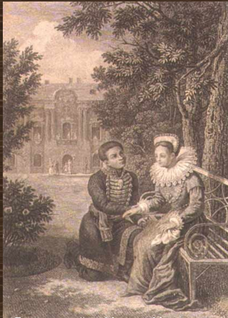
Лжедмитрий I и Марина Мнишек. Гравюра Г. Ф. Галактионова (начало XIX века)