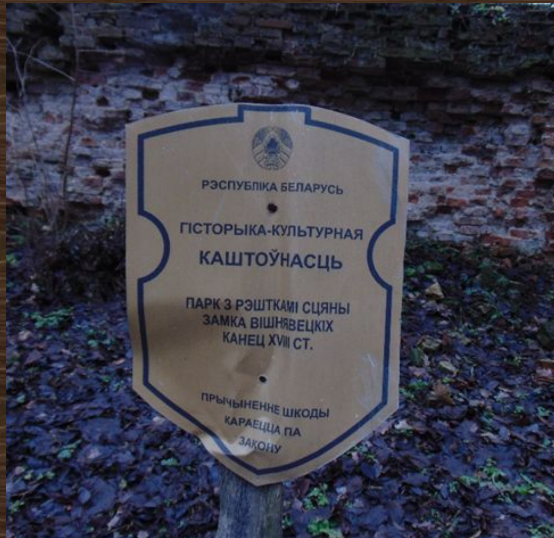
Состояние таблички в 2017 г.