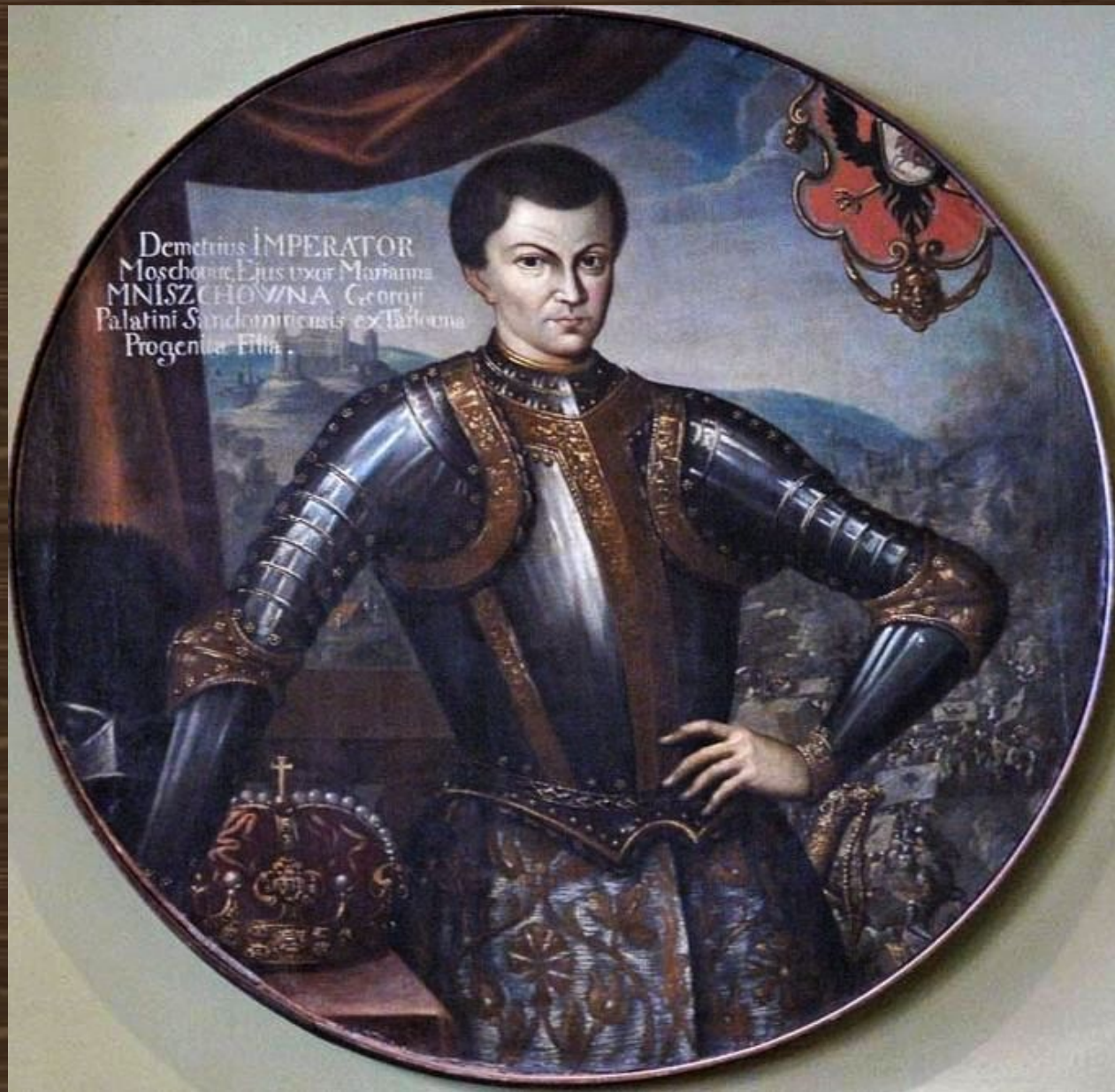
Портрет Лжедмитрия. Художник Шимон Богушович