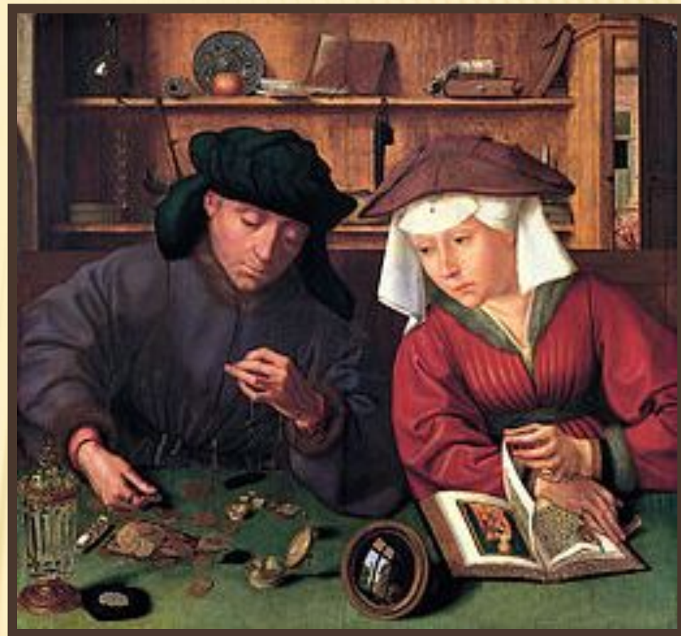
Квентин Массейс. Меняла с женой.

Банковским делом занимались преимущественно итальянцы и евреи.