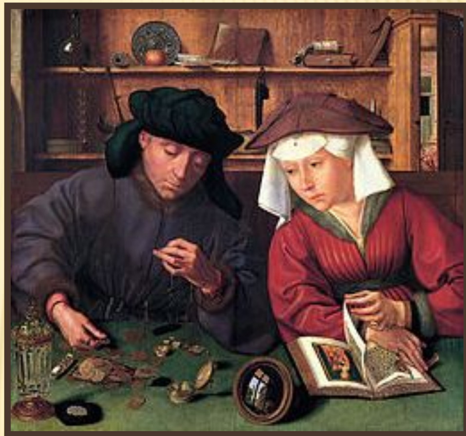
Квентин Массейс. Меняла с женой.

Банковским делом занимались преимущественно итальянцы и евреи.