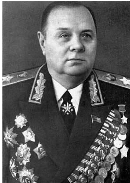
Кирилл Афанасьевич Мерецков. 1-й Дальневосточный фронт