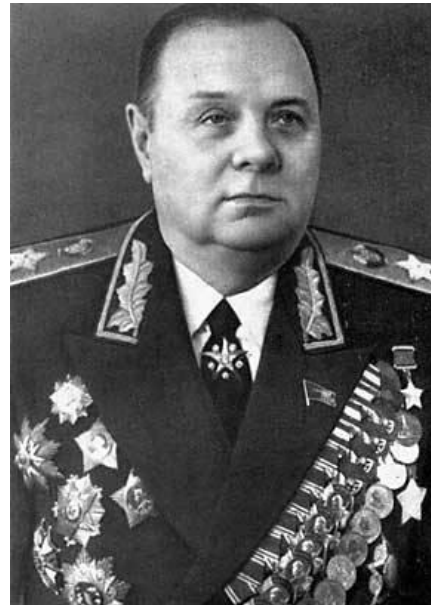
Кирилл Афанасьевич Мерецков. 1-й Дальневосточный фронт