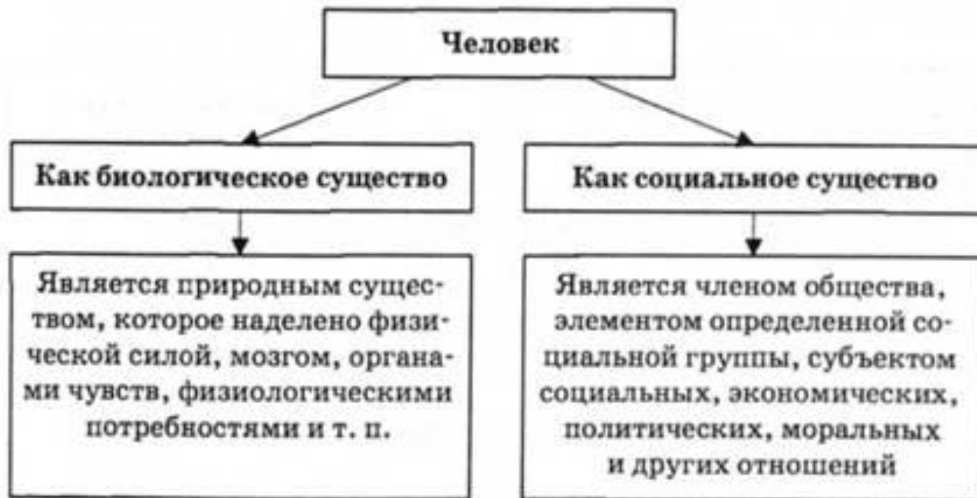
Рис. 3.14. Биосоциальные черты человека