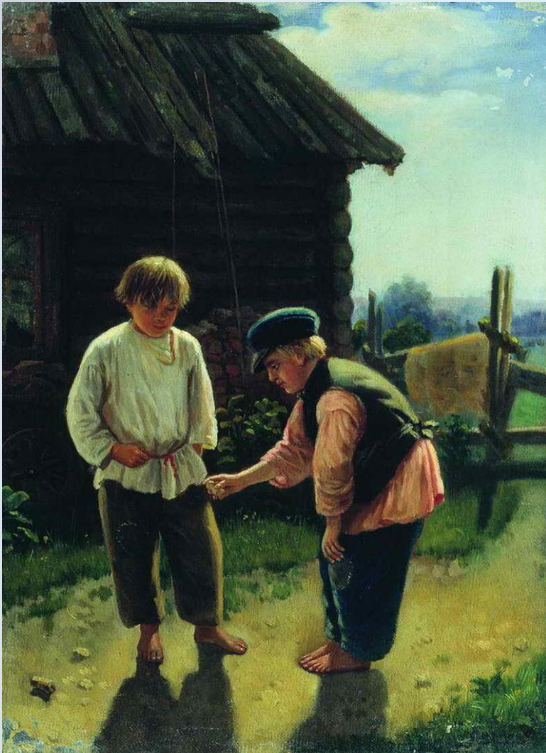
Художник Корзухин А. И.