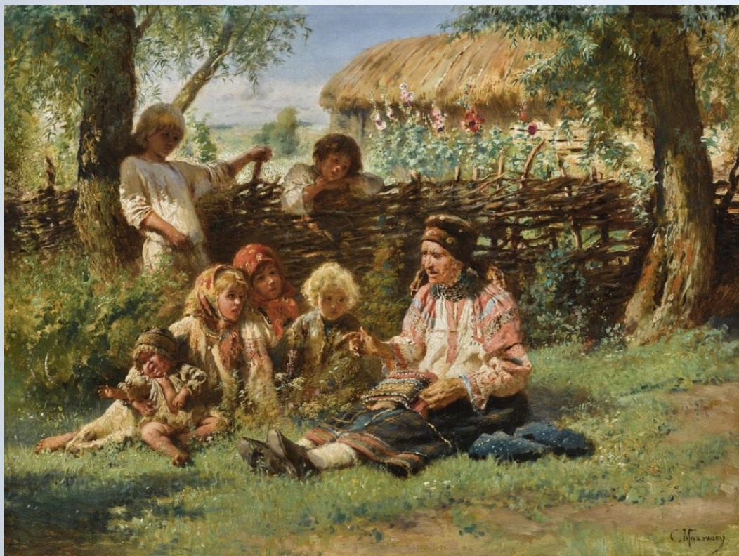
Художник Маковский В. Е.

Итак, обернуть мы обязаны кстати Другой стороною медаль. Положим, крестьянский ребенок свободно Растет, не учась ничему, Но вырастет он, если Богу угодно, А сгинуть ничто не мешает ему.