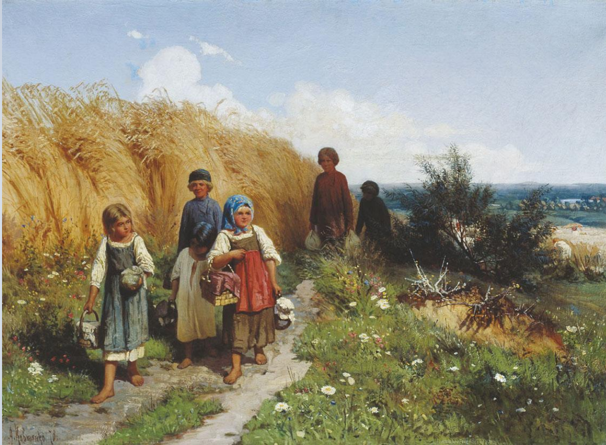
Художник Кившенко А. Д.

Играйте же, дети! Растите на воле! На то вам и красное детство дано, Чтоб вечно любить это скудное поле, Чтоб вечно вам милым казалось оно. Храните свое вековое наследство, Любите свой хлеб трудовой – И пусть обаянье поэзии детства Проводит вас в недра землицы родной!