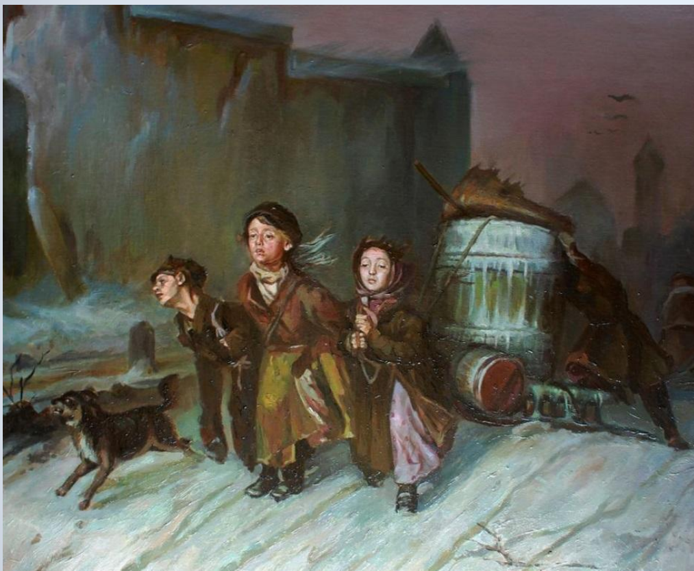
Художник Перов В.

Где уж нам, измученным в неволе, Ликовать, резвиться и скакать! Если б нас теперь пустили в поле, Мы в траву попадали бы – спать.