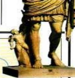
Статуя Маркусу Антонию. Статуя. I в.