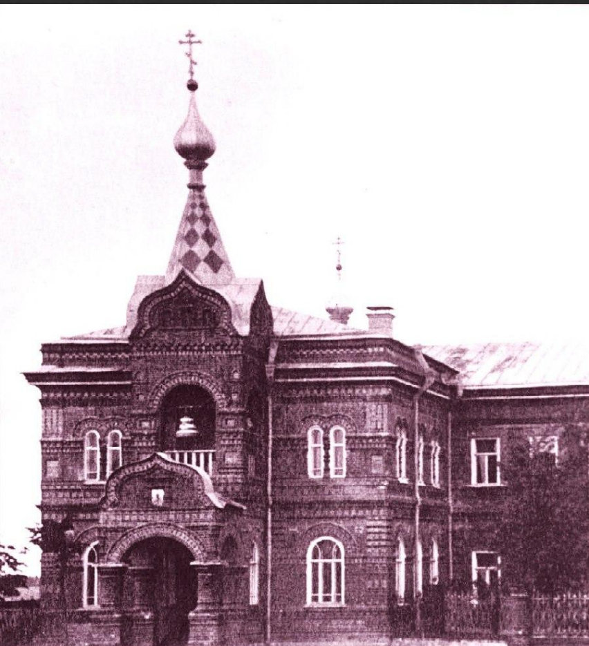
княже-михайловская церковь при училище слепых.