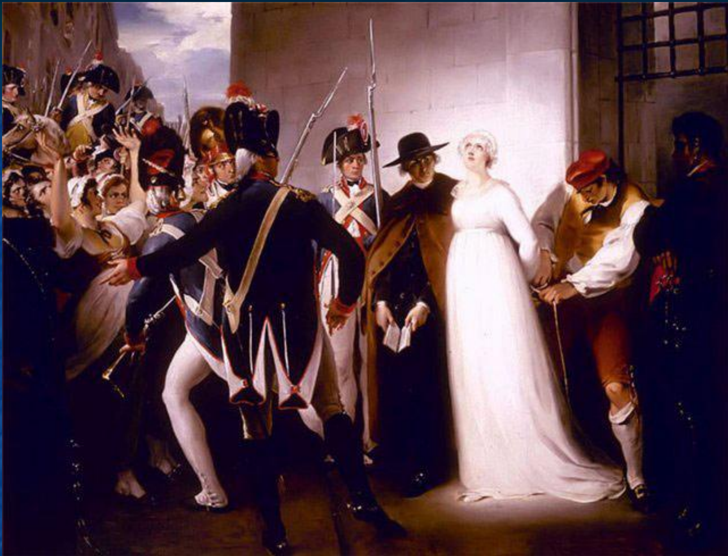
Октябрь 1793 г. казнь Марии Антуанетты