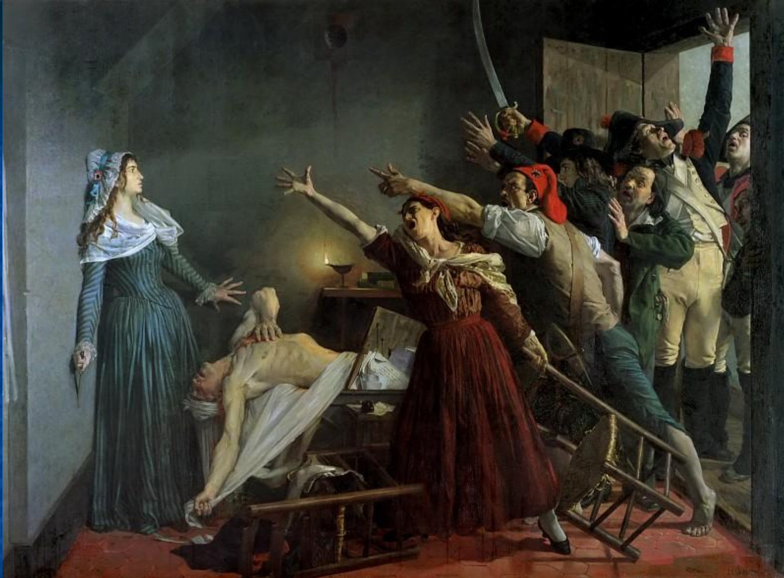
Картина: Жан Жозеф Вертс «Убийство Марата»