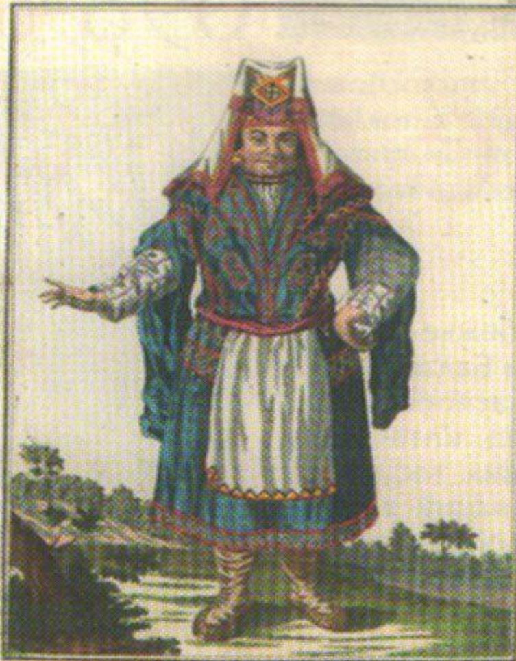
Bomruca. Cure Wotakim. Torne Wotakime.