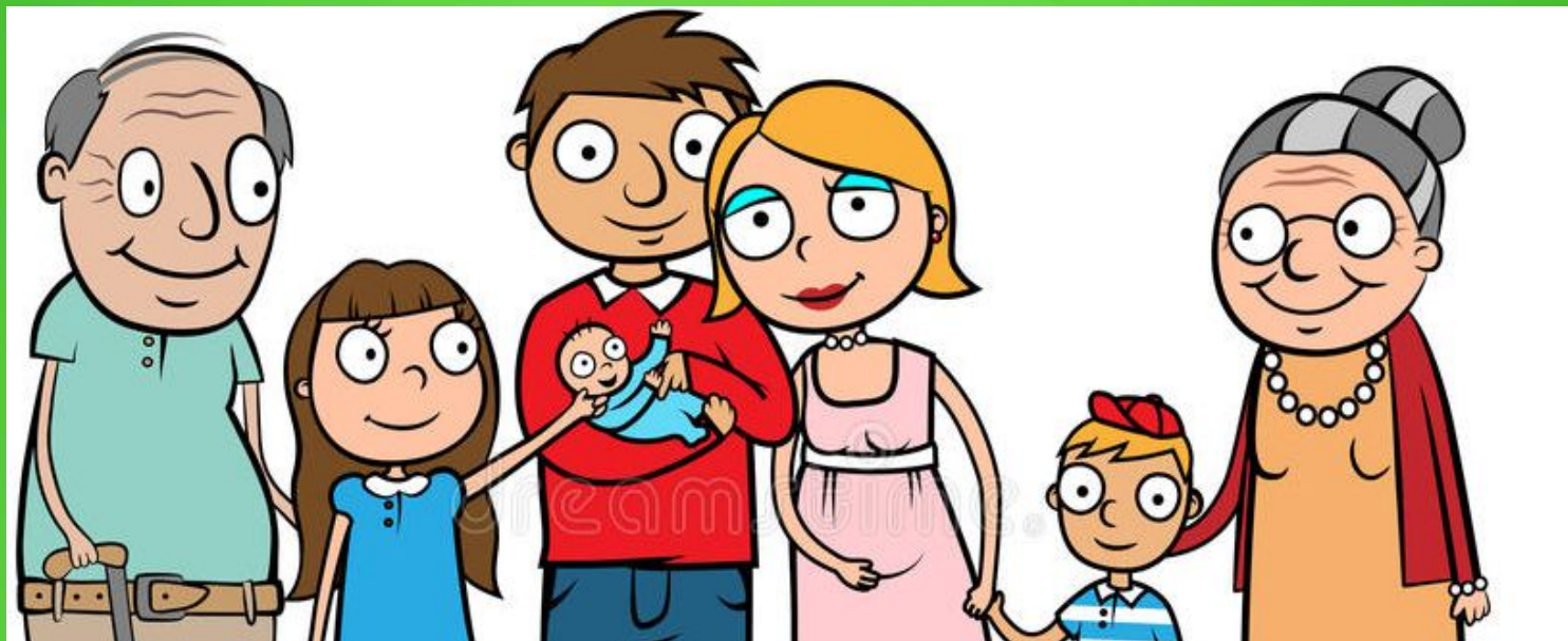
Семьи с детьми