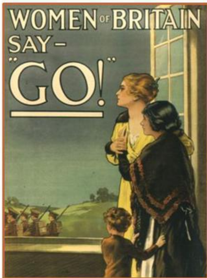
Английский плакат 1915 года

Начало войны – Усиление государственного контроля, особые полномочия правительств, ограничение прав парламентариев, запрещение национальных партий, цензура.