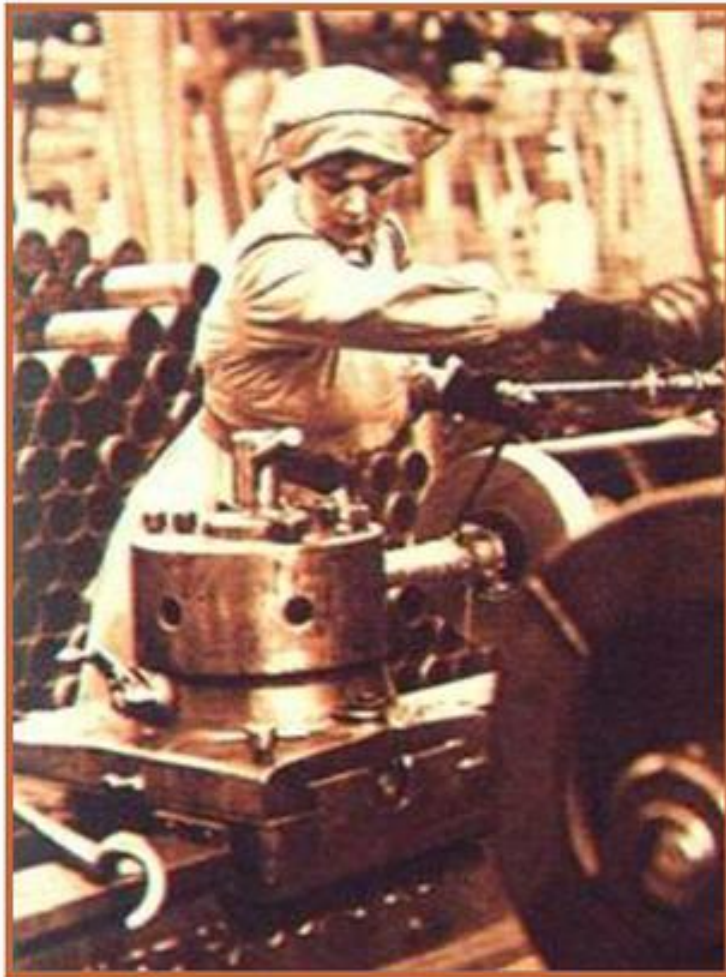
Военный завод В Англии.

Экономика воюющих стран перешла на выпуск военной продукции. Снабжение населения осуществлялось по карточкам.