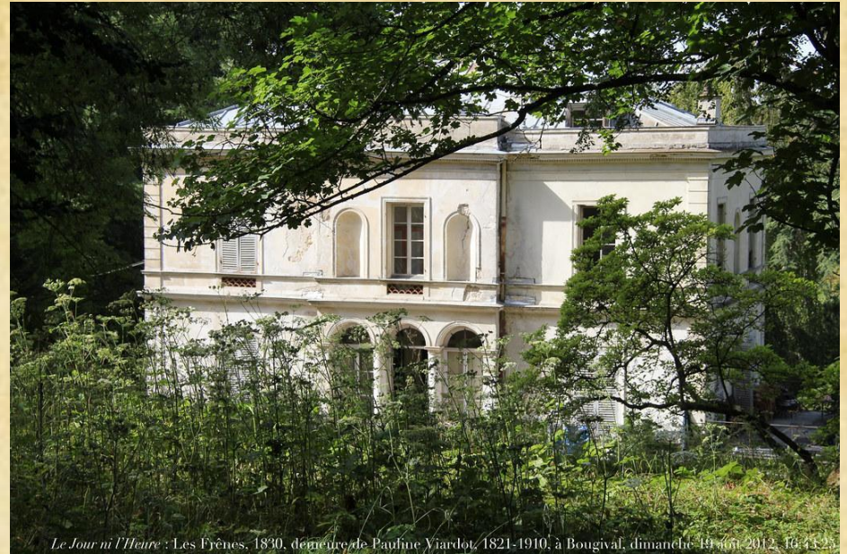
Вилла Полины Виардо

В 1874 году для Полины Виардо писатель приобретает дом XVIII века палладианского стиля. Имение он называет Ле-Френ, что в переводе на русский означает "Ясени".