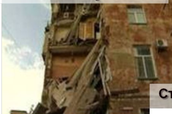
Строения в аварийном состоянии