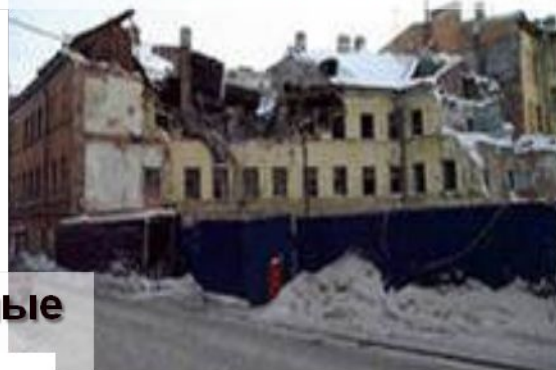
Строения в аварийном состоянии