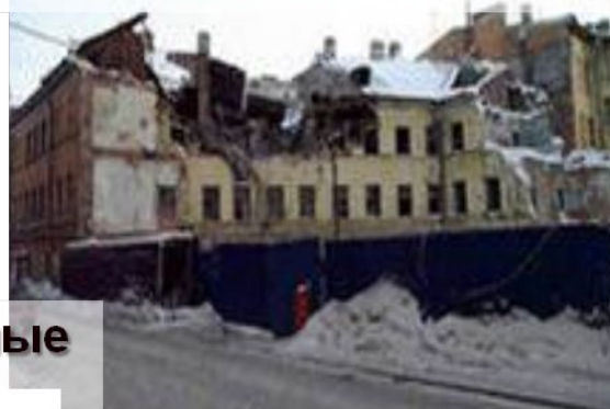
Строения в аварийном состоянии