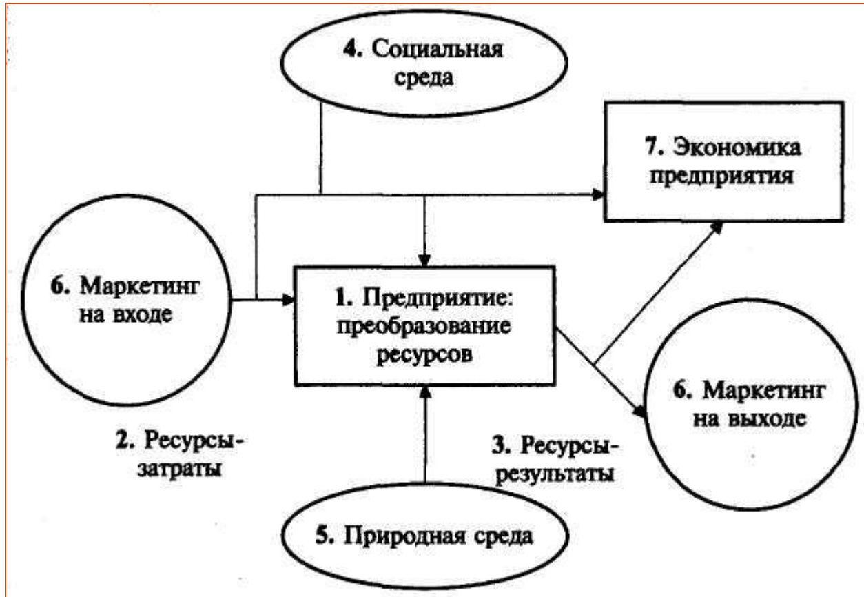
Рыночная модель предприятия

Любое предприятие независимо от организационно-правовой формы, формы собственности, отраслевой принадлежности, выпускаемой продукции или оказываемых услуг является открытой экономической системой .