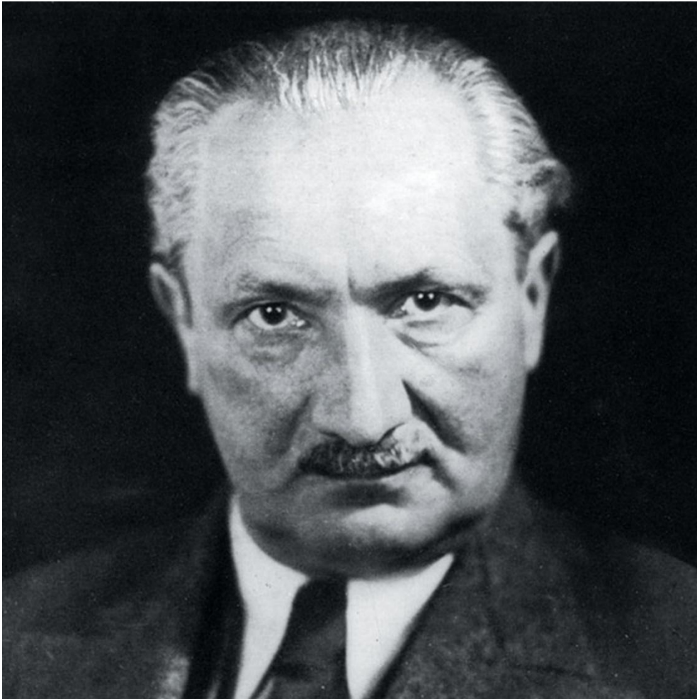
1938 – Время картины мира