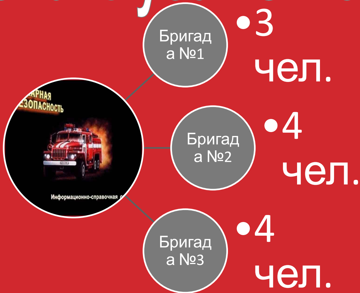
Схема клуба «Огнеборец»