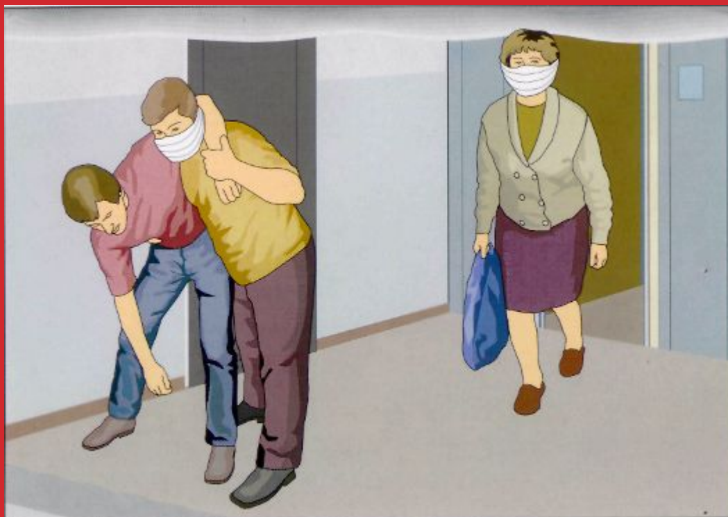
Эвакуировать людей из помещений