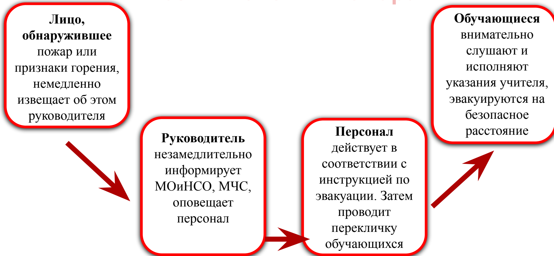
Схема действий руководителя, персонала и обучающихся при возникновении пожара

В КАЖДОМ КАБИНЕТЕ ИМЕЕТСЯ СПИСОК ОБУЧАЮЩИХСЯ С УКАЗАНИЕМ ФИО РОДИТЕЛЕЙ И ИХ ТЕЛЕФОНОВ