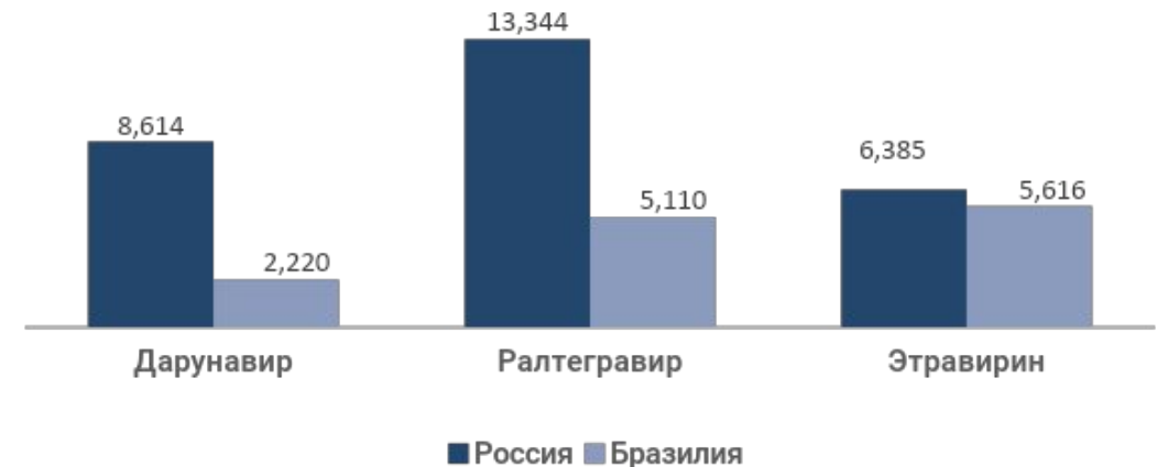
СРАВНЕНИЕ СТОИМОСТИ НЕКОТОРЫХ ПРЕПАРАТОВ ДЛЯ ЛЕЧЕНИЯ ВИЧ-ИНФЕКЦИИ