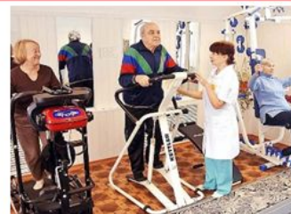
Медицинская помощь пенсионерам