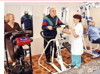
Медицинская помощь пенсионерам