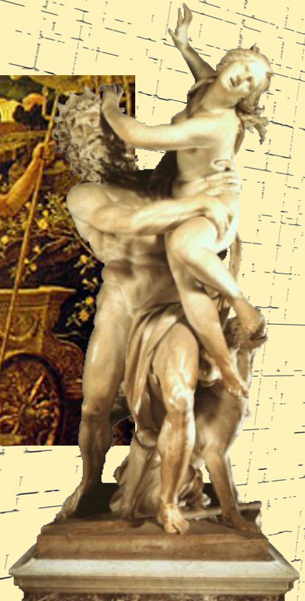
Похищение Персефоны. Сер. XIX в. (Грен).