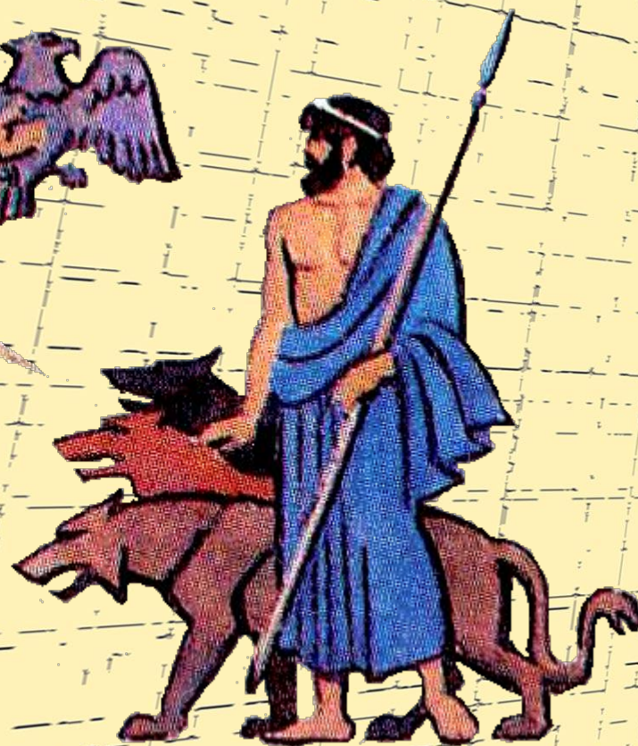
Аид («царство мёртвых»)