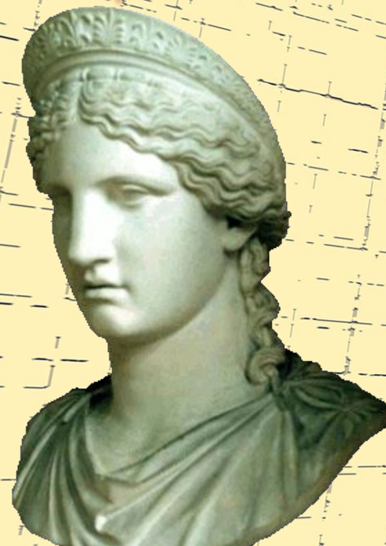
Гера (богиня брака и супружеских уз)