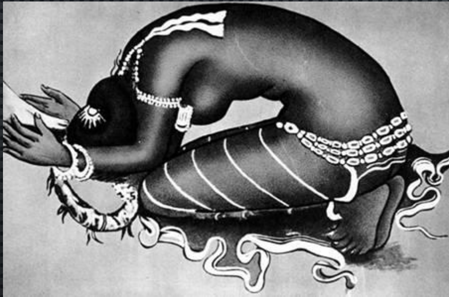
Танцовщица, молящая раджу о пощаде