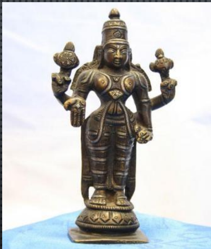
Статуэтка бога Вишну. 19 в.