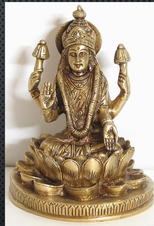
Бронзовая скульптура Лакшми. 20в.