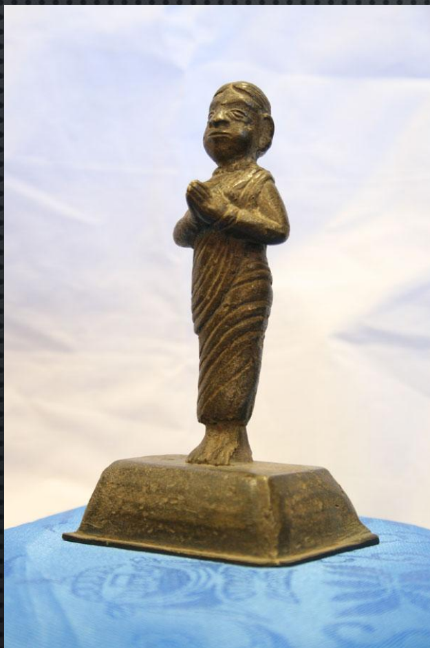
Молящая женщина. 20 в.