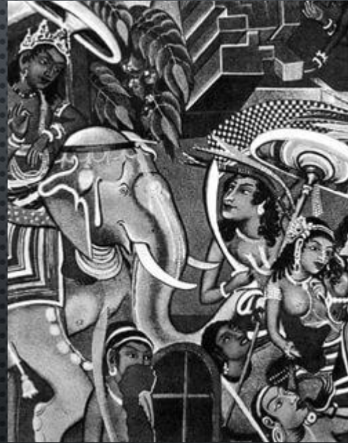
Выезд раджи Махаджанани.