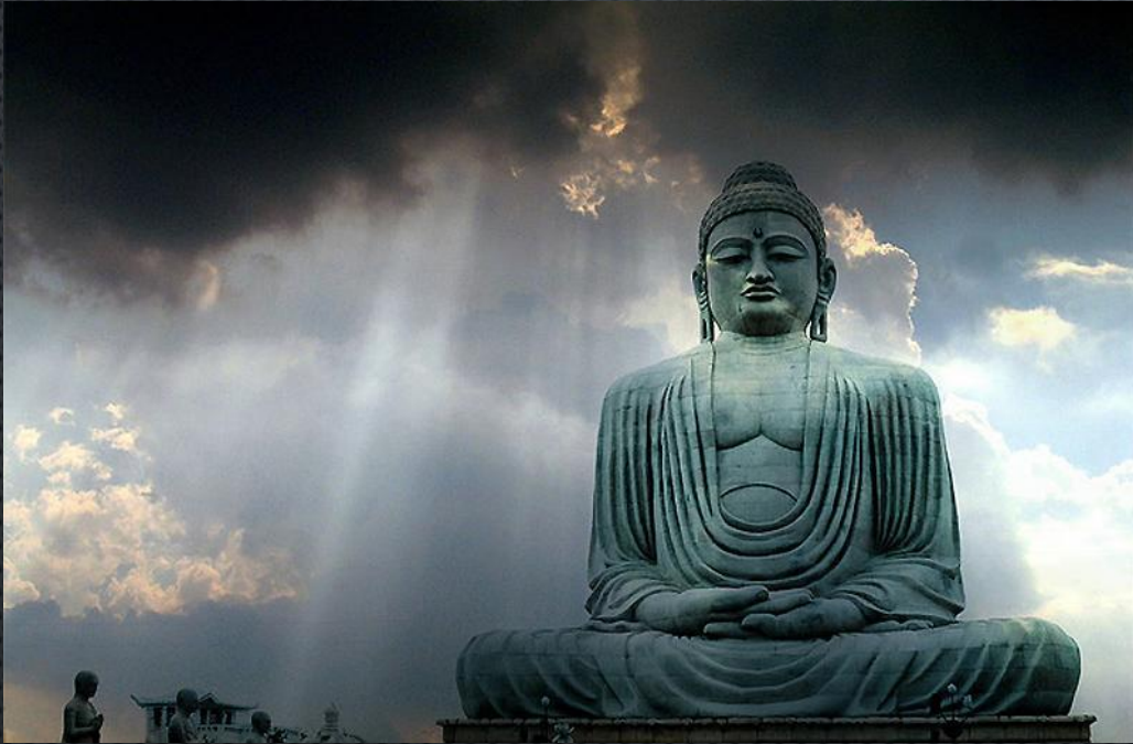
Скульптура Статуя Будды