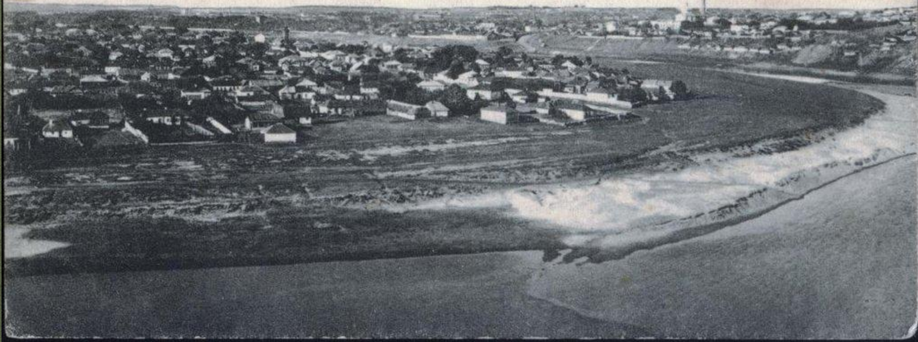
г. Елецъ. Общій видъ. Панорама № 1.