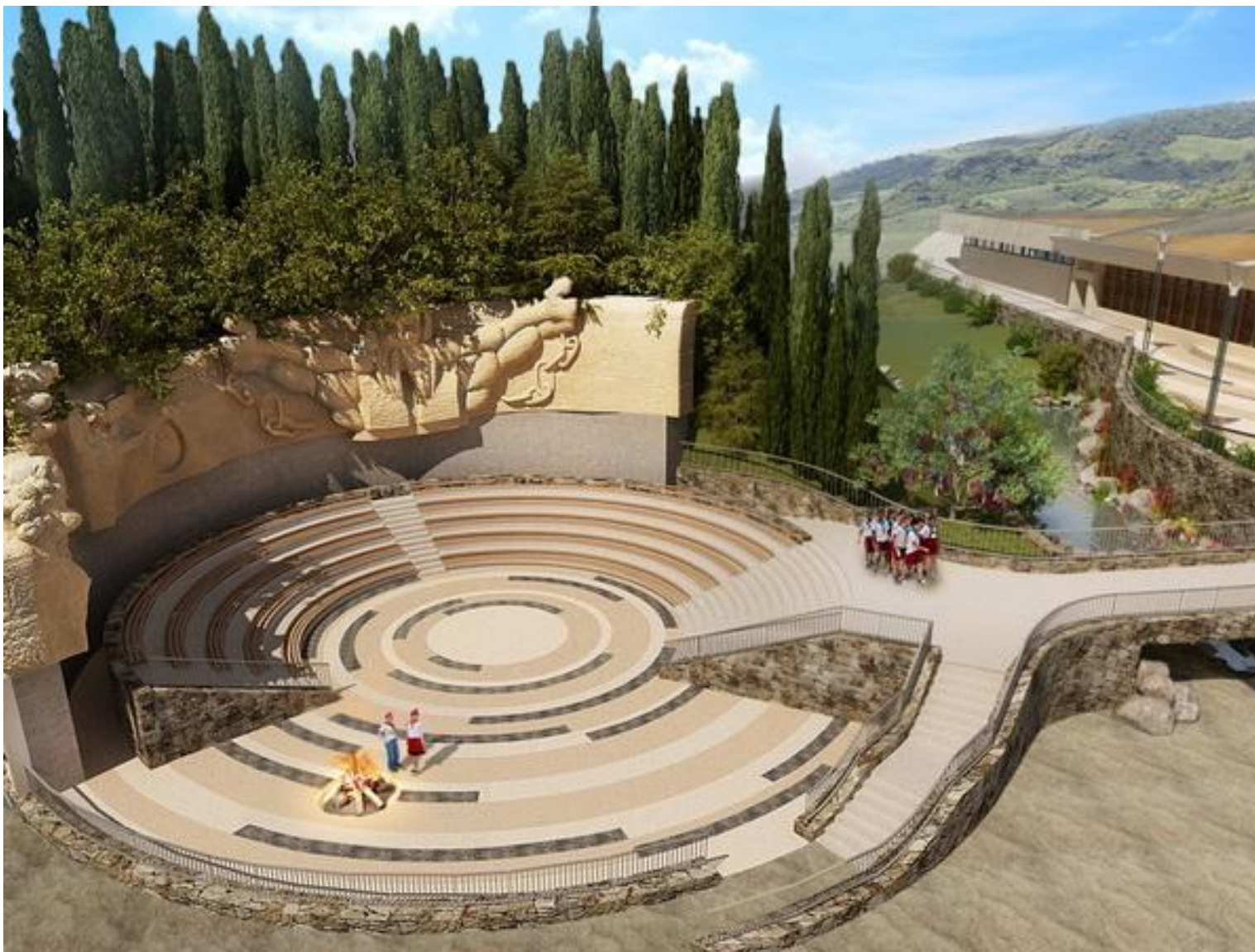
Проект реконструкции и восстановления монумента