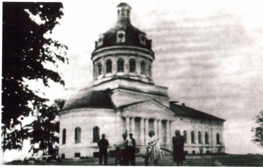
Свято-троицкая церковь, Сибирский тракт