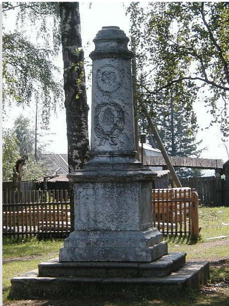
Памятник Александру 2