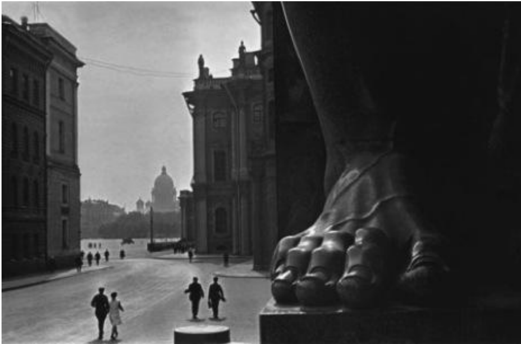
фотография начала 30-х годов XX века Бориса Игнатовича — классика отечественной фотографии.