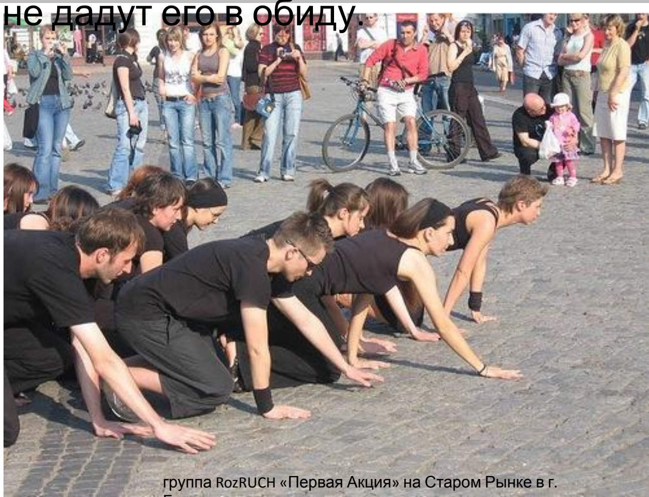
группа RozRUCH «Первая Акция» на Старом Рынке в г.

Танцоры постмодерна удивляли зрителя неожиданными сбоями, балетными эксцессами, фокусами, но теперь они уже заботятся о теле и никому не дадут его в обиду.