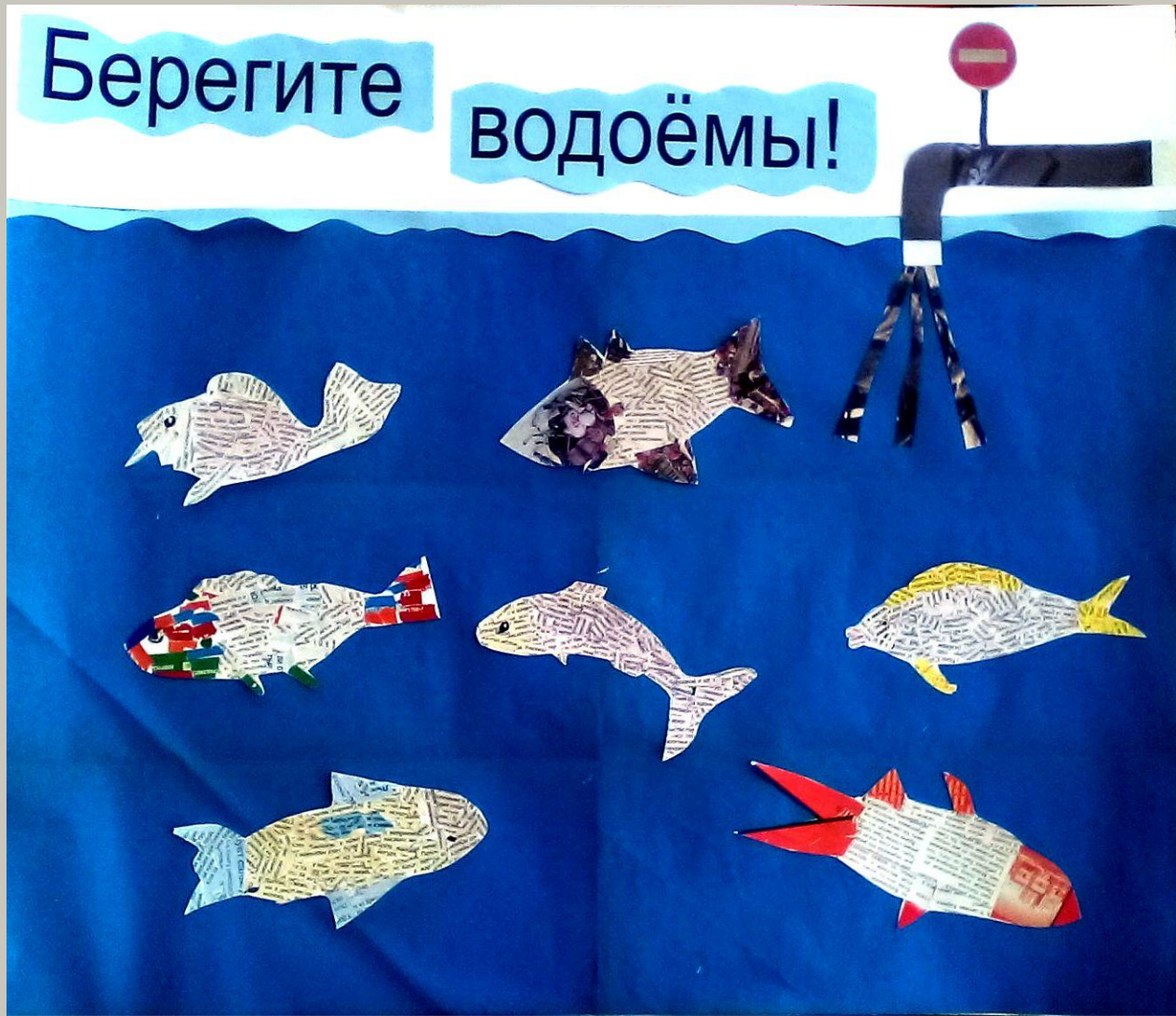
Коллективная работа на тему «Вода живительная сила»