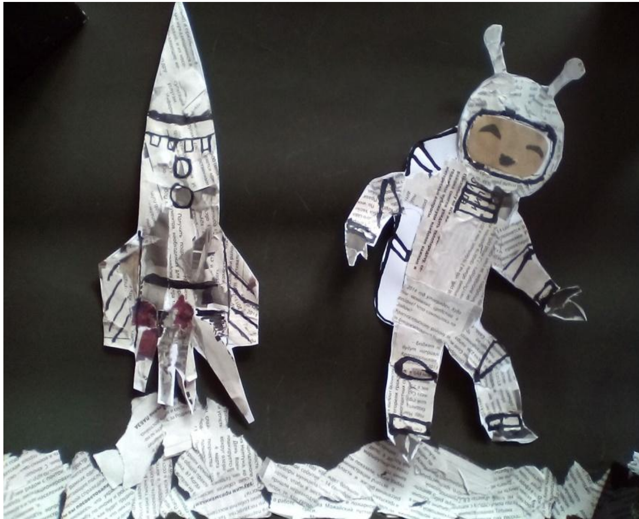
Детская работа на тему «Космос»