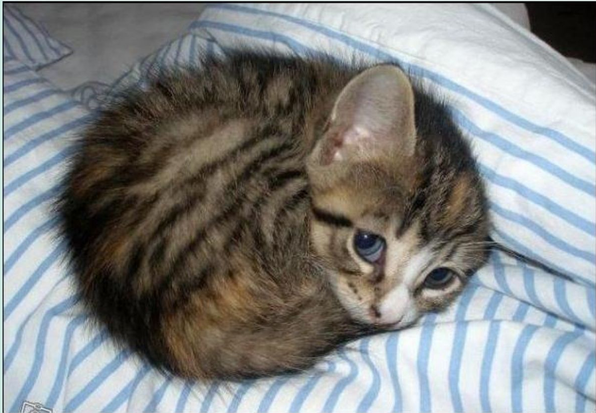
Котенок-шпион. Обратите внимание на геометрию зрачка левого «глаза».