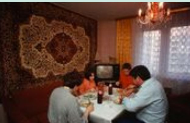
РАМОЧНЫЙ РЕЗОНАТОР, ЗАМАСКИРОВАННЫЙ ПОД КОВЕ

ТАКИМ ОБРАЗОМ, НАСЕЛЕНИЕ НА ДОБРОВОЛЬНОЙ ОСНОВЕ СТАЛО ПРИОБРЕТАТЬ ПСИХОТРОННЫЕ УСИЛИТЕЛИ И РАЗВЕШИВАТЬ ИХ НА СТЕНАХ СВОИХ КВАРТИР. ЧАСТО ДАЖЕ НАД КРОВАТЯМИ.