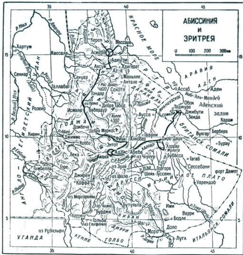
Рис. 1. Маршрут экспедиции Н. И. Вавилова в 1926—1927 гг.