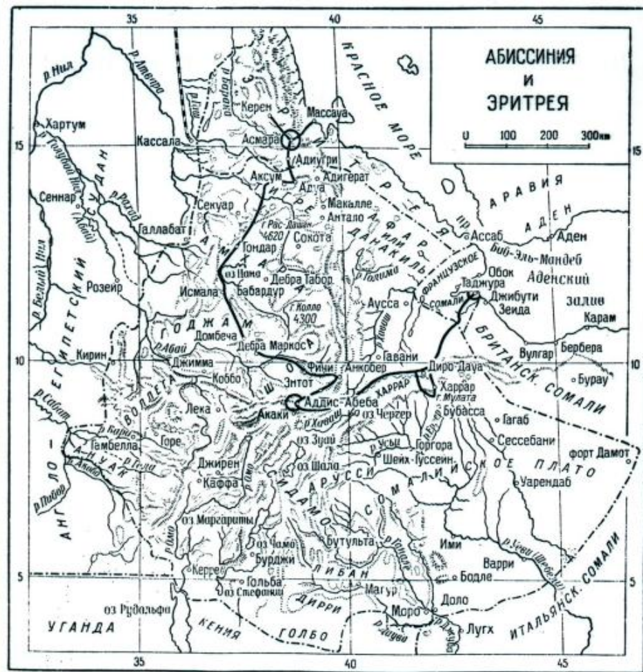
Рис. 1. Маршрут экспедиции Н. И. Вавилова в 1926—1927 гг.