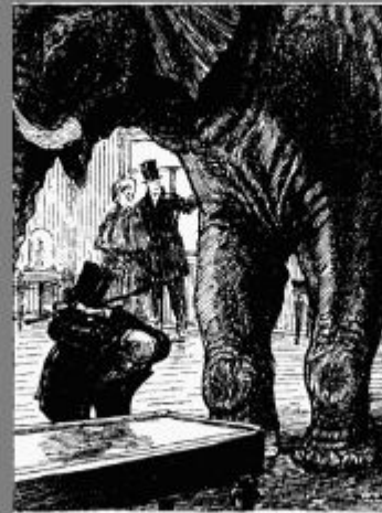
Иллюстрация к басне И. А. Крылова "Любопытный"