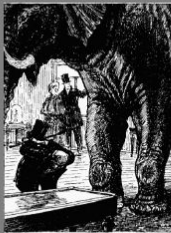
Иллюстрация к басне И. А. Крылова "Любопытный"