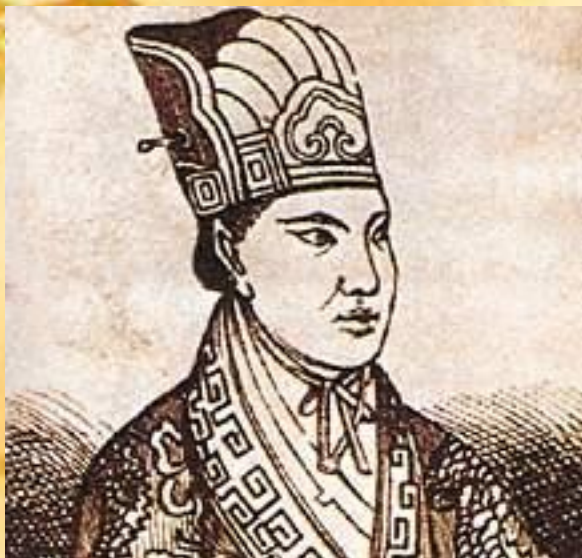
Лидер: Хун Сюцюань (1814—1864)