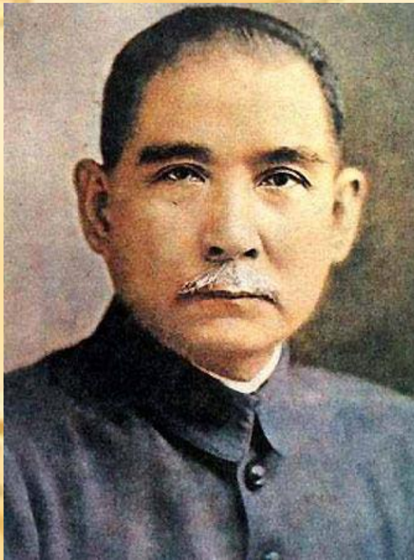
Лидер: Сунь Ятсен