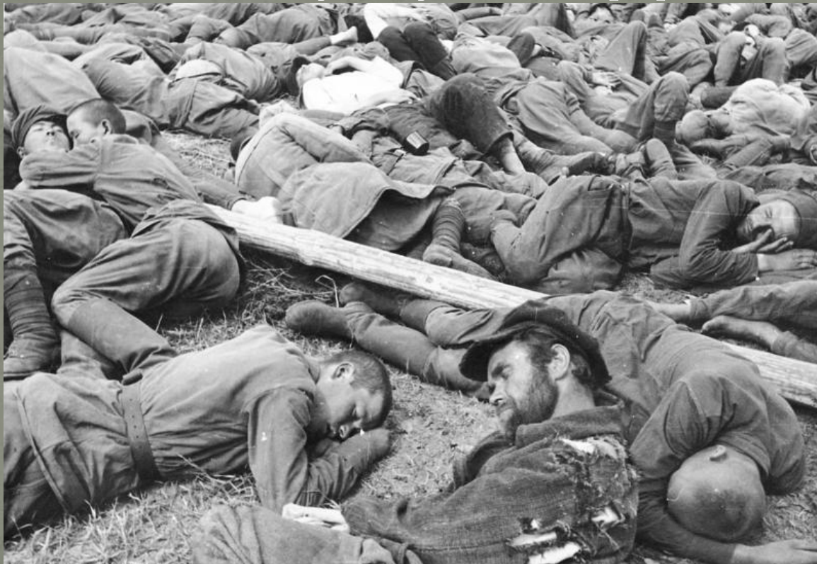
3. Juli 1942