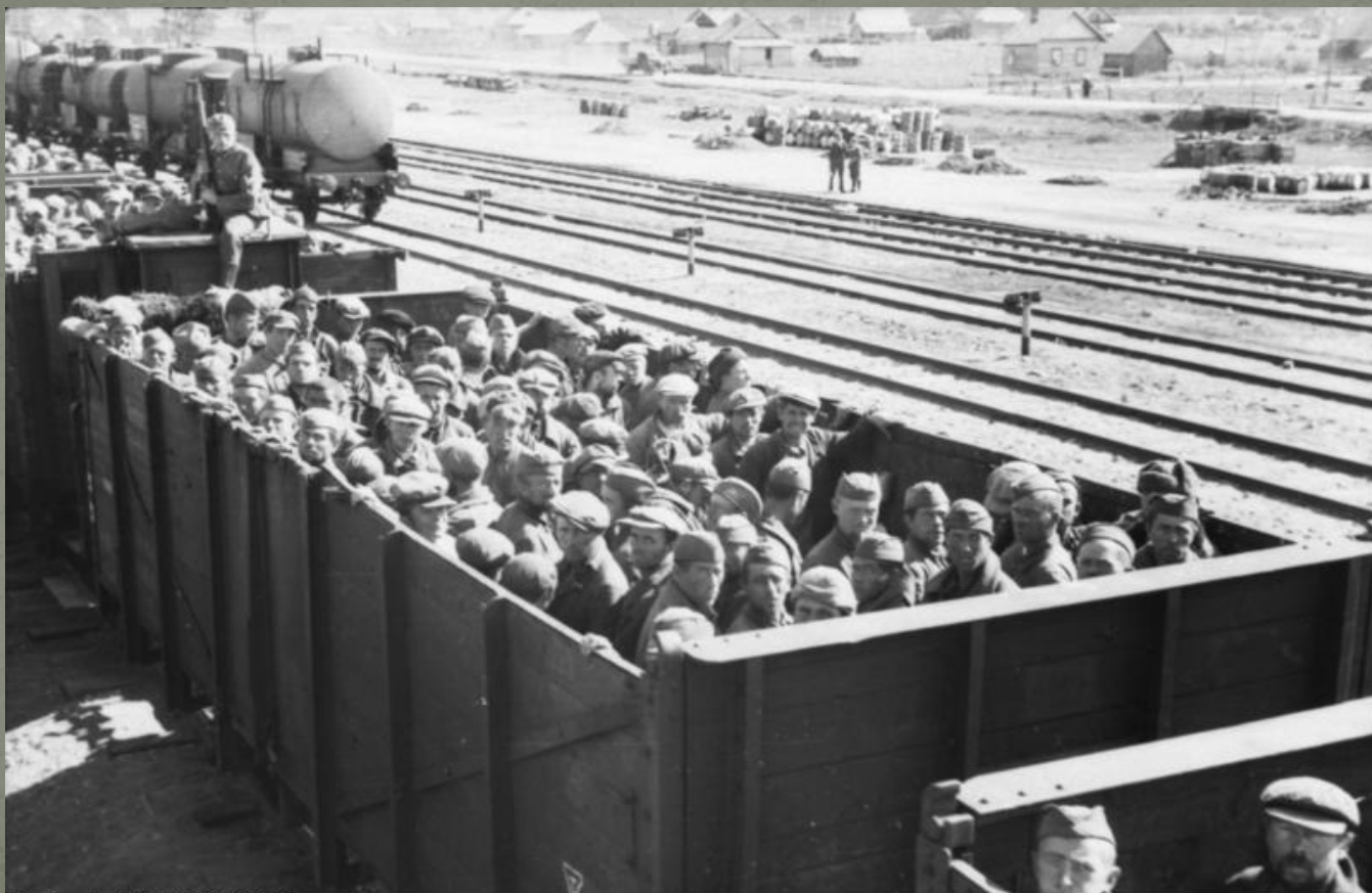
21. September 1941