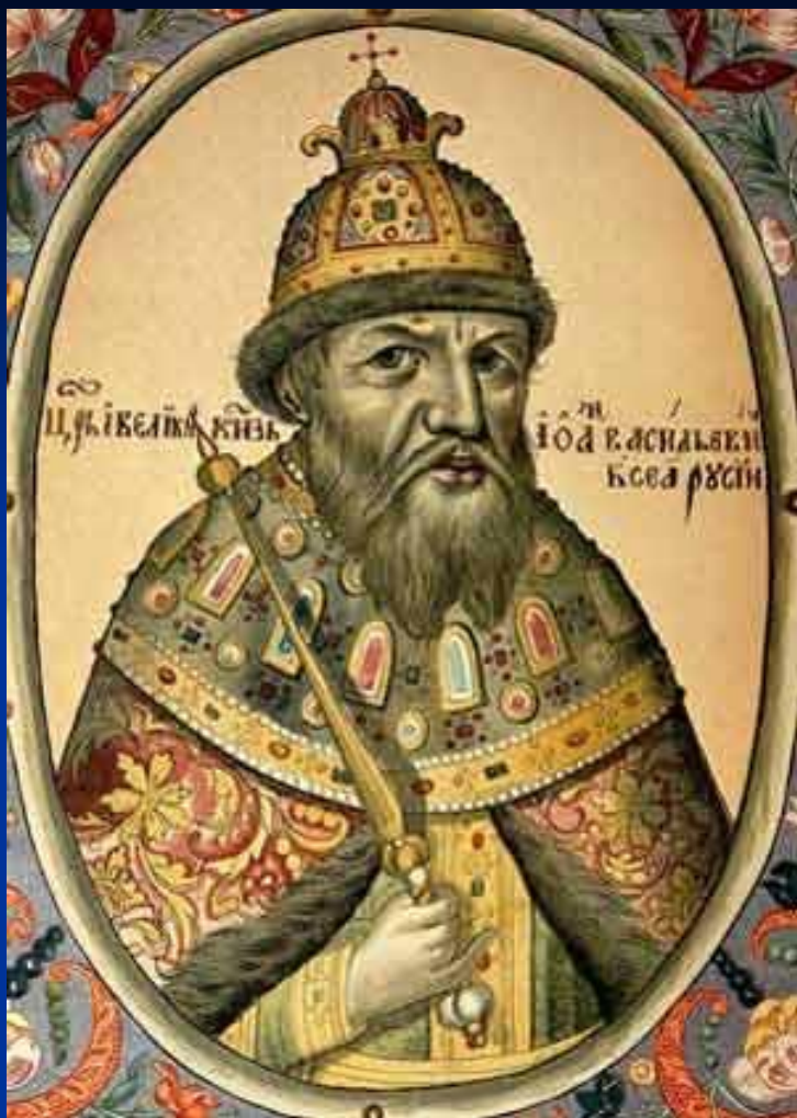
Великий князь Иоанн IV Васильевич (миниатюра из Царского титулярника 1672 г.)