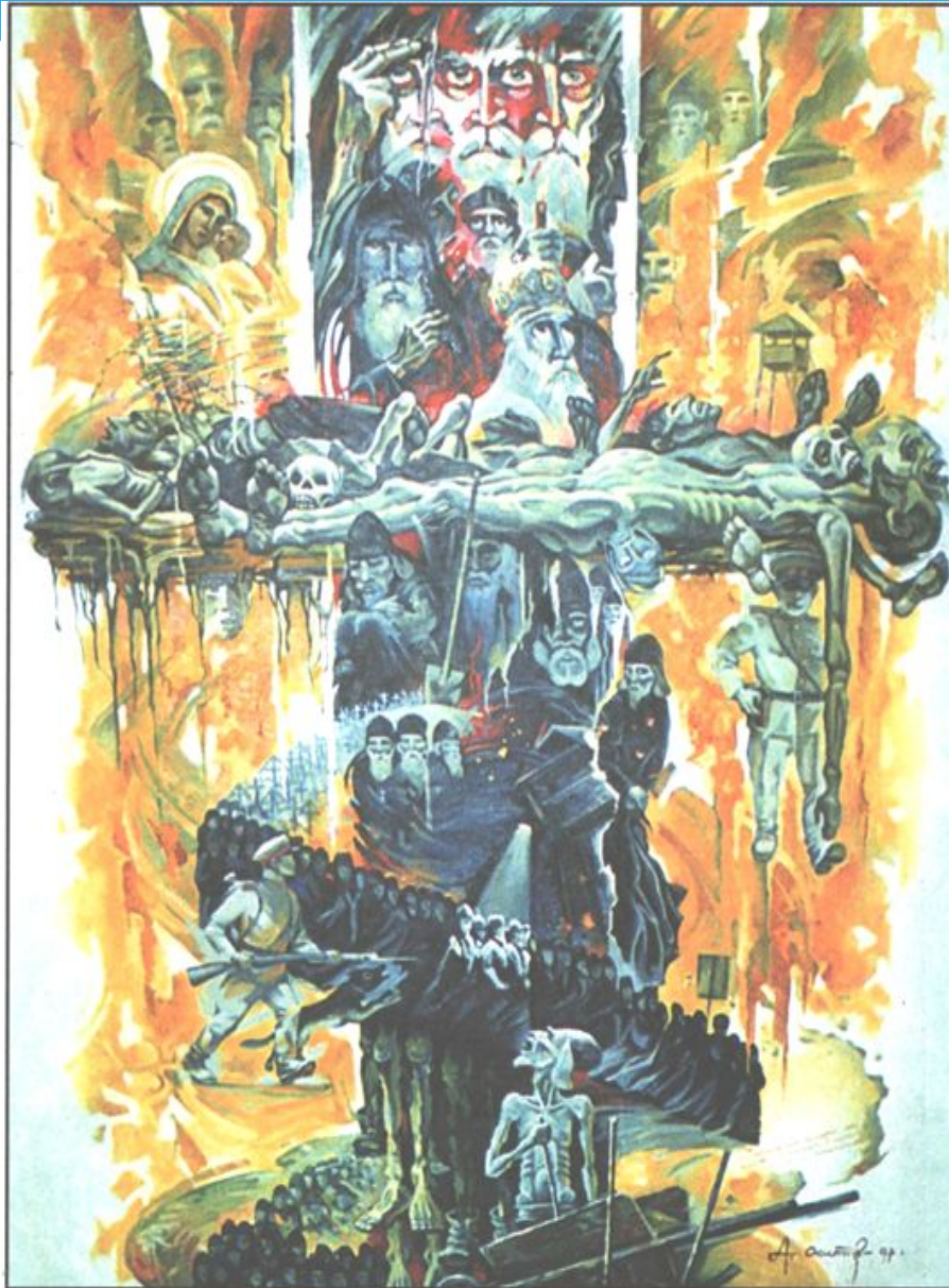
Картина Осипенко А.И. Ведут «врагов народа» (Монахи в КарЛаге). 1997 г.