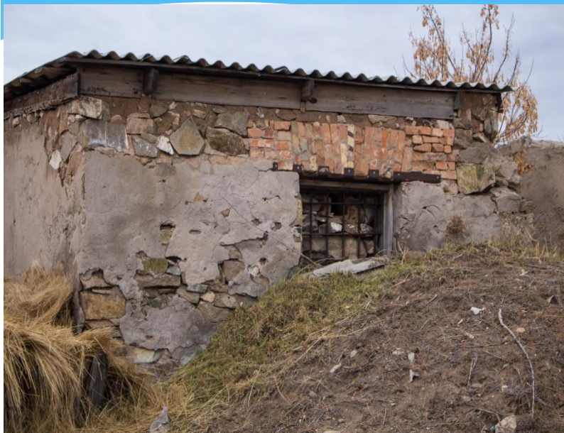
Фото сохранившейся части карцера в селе Есенгельды. Самарское отделение Карлага.