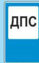
7.12 "Пост дорожно-патрульной службы"