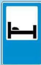
7.9 "Гостиница или мотель"