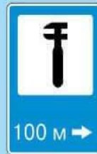
7.4 "Техническое обслуживание автомобилей"