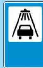
7.5 "Мойка автомобилей"