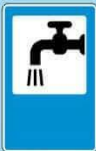
7.8 "Питьевая вода"