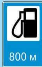
7.3 "Автозаправочная станция"