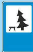
7.11 "Место отдыха"