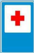
7.1 "Пункт первой медицинской помощи"