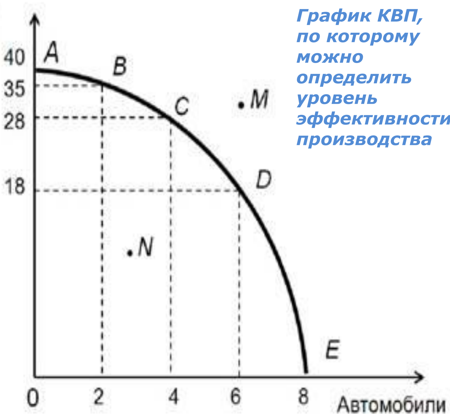
График КВП, по которому можно определить уровень эффективности производства