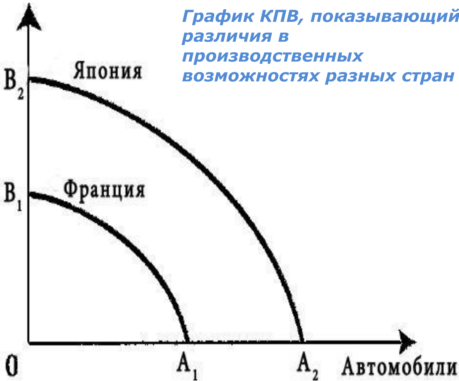
График КПВ, показывающий различия в производственных возможностях разных стран