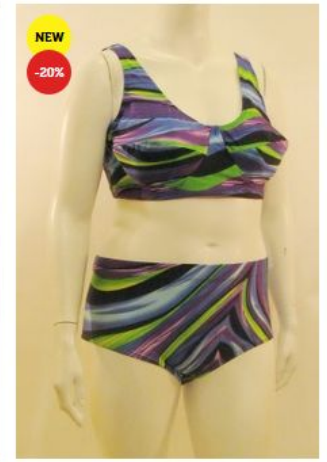
Купальник КРБ3 КУПАЛЬНИКИ 2 900 руб. 3 600 руб.

www.test1.it-kreativ.by/catalog/kupalniki/kl2b11.html