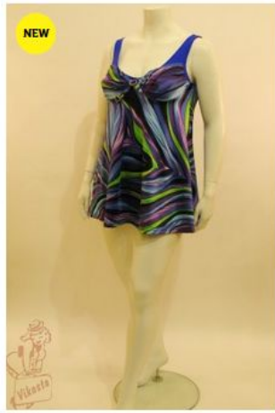
Купальник КЛ2Б12 КУПАЛЬНИКИ 4 600 руб.