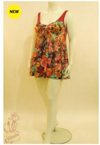
Купальник КЛ2Б11 КУПАЛЬНИКИ 4 000 руб.