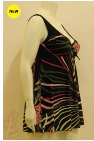
Купальник КЛ2Б1(1) КУПАЛЬНИКИ 4 000 руб.