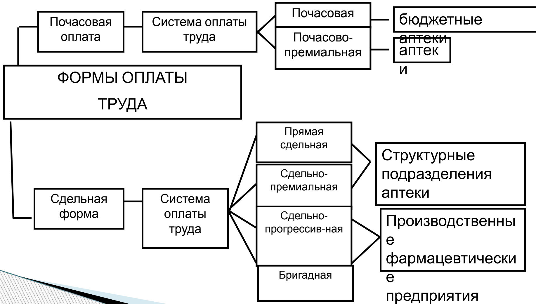
Рис. 1. Формы и системы оплаты труда