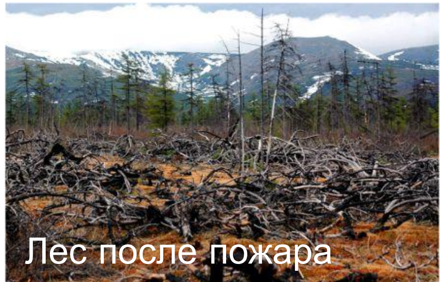
Лес после пожара