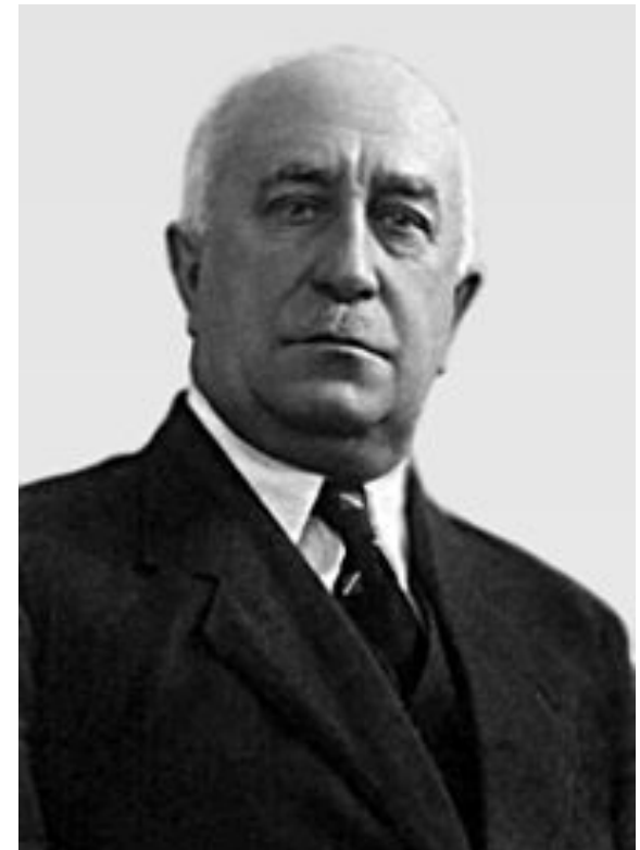
В. Н. Сукачёв