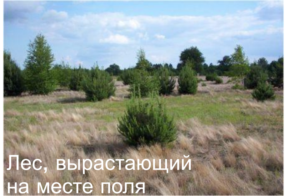
Лес, вырастающий на месте поля