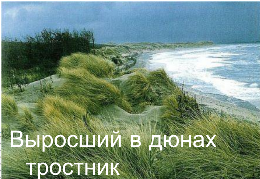
Выросший в дюнах тростник