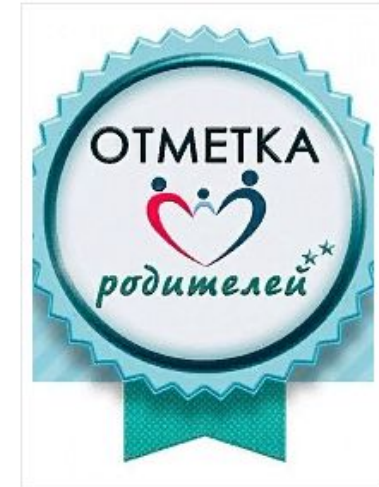
ГЕЛЬ ДЛЯ СТИРКИ УШАСТЫЙ НЯНЬ ПОЛУЧИЛ ЗОЛОТОЙ ДИПЛОМ КОНКУРСА «ОТМЕТКА РОДИТЕЛЕЙ»