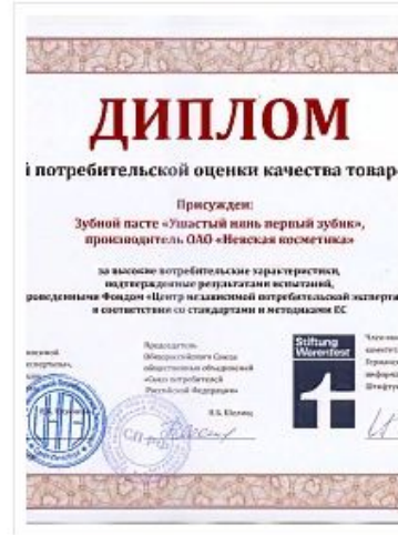
ЗУБНАЯ ПАСТА ДЕТСКАЯ УШАСТЫЙ НЯНЬ ПЕРВЫЙ ЗУБИК ДИПЛОМ ЗА ВЫСОКИЕ ПОТРЕБИТЕЛЬСКИЕ ХАРАКТЕРИСТИКИ